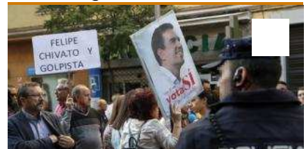
Comité Federal PSOE