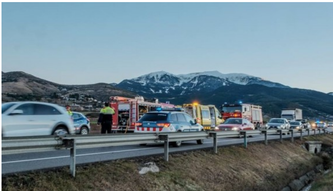
L'accident ha provocat retencions de trànsit

L'accident s'ha produït a les 17.00 hores i ha necessitat de la intervenció dels bombers en d'excarceració dels ocupants del vehicle. Al lloc dels fets hi han arribat tres dotacions dels Mossos d'Esquadra, dues ambulàncies d'Emergències Mèdiques de Cerdanya, personal del servei de l'Àrea del Túnel del Cadí i els bombers d'Alp, Puigcerdà i Guardiola.