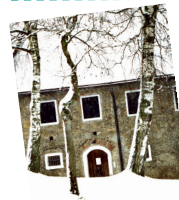
Casa de Bernhard