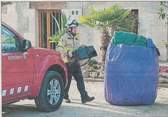
Un bomber amb el motor de l'atracció i l'inflable plegat