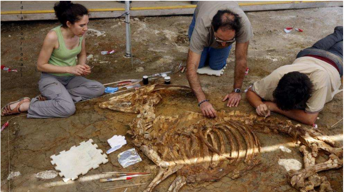
El nuevo esqueleto encontrado en el yacimiento de Caldes de Malavella

Las sucesivas campañas permiten descubrir que los cuernos no eran una característica distintiva de los machos