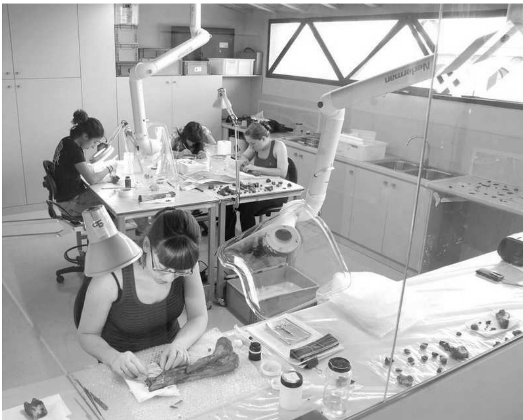
Treballs de restauració al nou laboratori de Caldes de Malavella