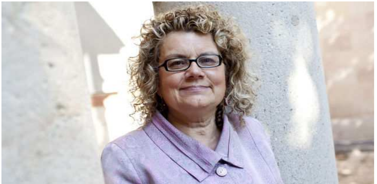
La diputada Marina Geli.

M reconoce porque continúan haciendo comisiones ejecutivas, mítines... La gente piensa I P que estos partidos no estuvieron lo bastante atentos a ver, sobre todo los últimos 10 años, que se había gestado un modelo económico con pies de barro que ha generado muchas desigualdades. Las desigualdades son muy sustantivas en la sociedad catalana, con consecuencias personales y colectivas muy importantes. No hemos querido crear un nuevo partido y hablamos de movimiento porque, con mucha humildad, tenemos que apostar hacia modelos más auto-organizativos y mucho más abiertos, no tanto de militancia o jerarquía estricta. Y otra cosa importante que está en cuestión es la transversalidad de los partidos. Todavía creo en partidos de vocación mayoritaria, con líderes fuertes, con un proyecto reformista y con acciones concretas y comprobables para transformar las cosas.