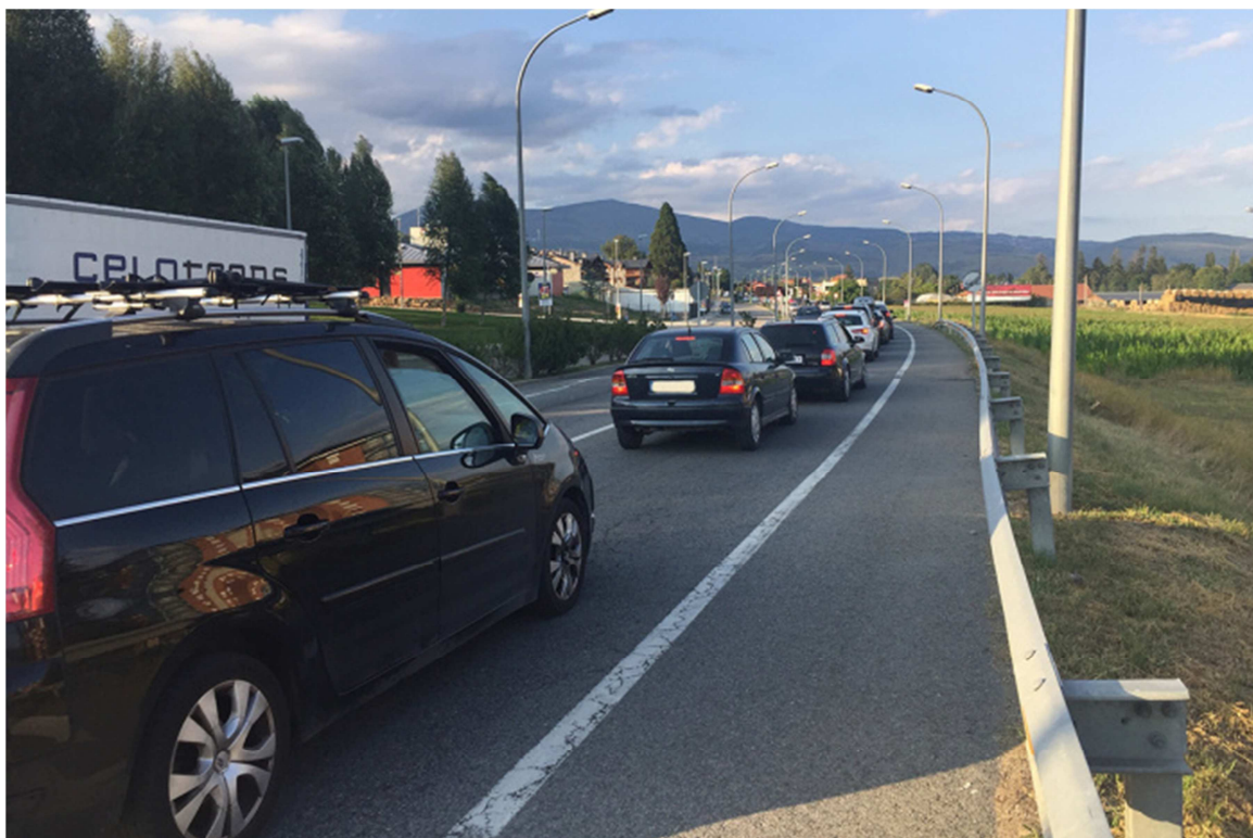
Cues de cotxes abans d'arribar a la rotonda de la plaça d'Europa i a l'antiga duana de Puigcerdà.

Els Mossos d'Esquadra han activat diferents controls de sortida a la ciutat de Barcelona, fet que ha provocat el col·lapse circulatori, principalment a les rondes de la capital catalana. Els controls de la policia catalana també s'han realitzat a diferents punts de Catalunya, com ara a Puigcerdà . A la capital de la Cerdanya s'han registrat cues a les carreteres que desemboquen a la rotonda ubicada a l'antga duana, bàsicament.