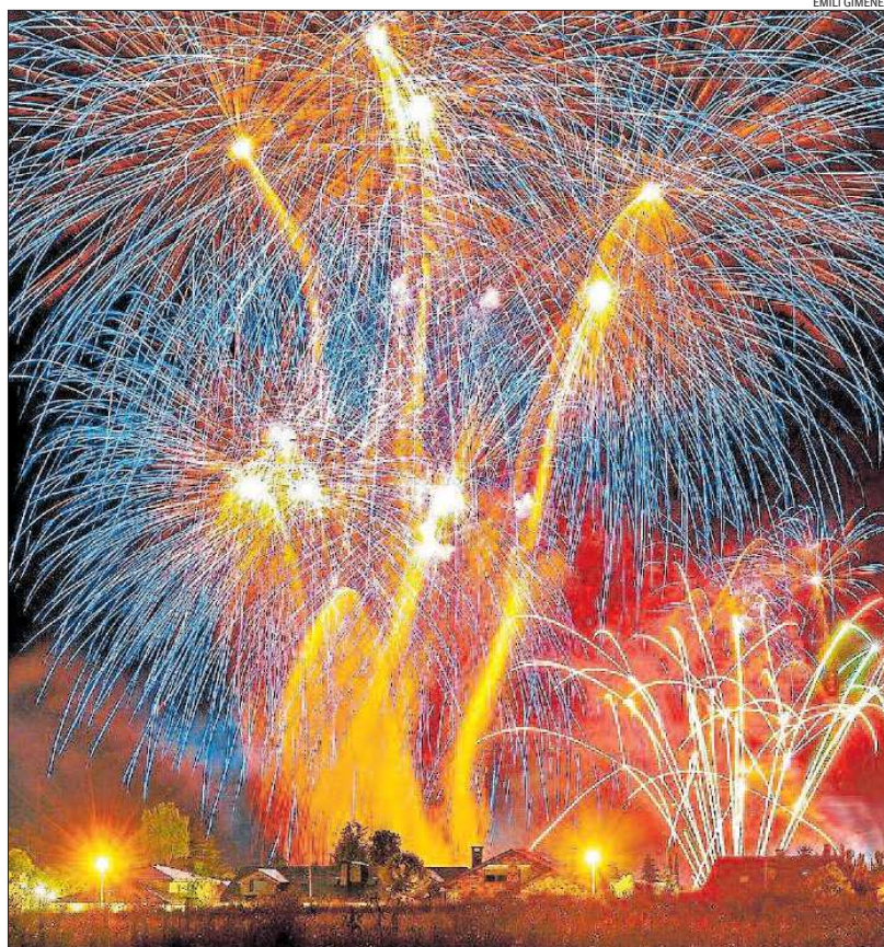
El castell de focs sobre l'estany que tanca cerimoniosament la festa i simbòlicament l'estiu a Puigcerdà

Per segon any, la festa se celebra l'últim cap de setmana d'agost gràcies a la nova normativa que va estrenar l'any passat el consistori per tal d'assegurar-se que no se celebrés correlativament a la setmana de la Mare de Déu d'Agost i l'últim cap de setmana d'agost quedés sense actes forts. D'aquesta manera, si fins l'any passat la Festa de l'Estany se celebrava al voltant del primer cap de setmana de la segona desena del calendari, ara se celebra l'últim cap de setmana de la tercera desena d'agost. Tant és així que tradicionalment la festa podia caure entre el 20 i el 26 d'agost i ara ho fa imperiosament entre el 23 i el 29. Amb aquesta nova normativa s'allarga la temporada turística fins ben bé el final de mes. La decisió ha comportat de retruc que coincideixi amb la Festa Major de la Seu d'Urgell.