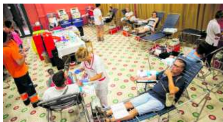
«La resposta ha estat excel·lent»

Les donacions de sang abundants i immediates de finals de la setmana passada, just després del desastre de les Rambles, han donat el seu fruit. Per una banda, la solidaritat ha fet possible que el Banc de Sang i Teixits de Catalunya comptés amb reserves suficients per atendre tots els pacients i, per altra banda, el creixent nombre de donacions per dia ha fet que en menys d'una setmana pugessin les reserves de tots els grups sanguinis,