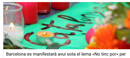
Barcelona es manifestarà avui sota el lema «No tinc por» per