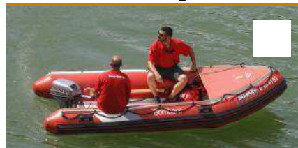
Recerca d'una parella desapareguda a Susqueda