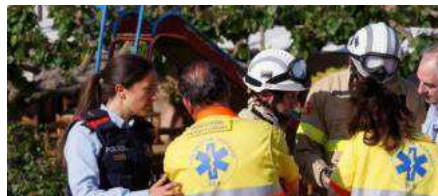
L'accident del castell inflable es va produir al maig a Mas Oller.

L' Ajuntament de Caldes de Malavella reconeixerà el pròxim 28 d'octubre la tasca realitzada pels primers agents policials que van actuar en l' accident del castell inflable en què va morir una nena de sis anys. Els fets van passar el 7 de maig a tres quarts de quatre de la tarda al restaurant Mas Oller, quan l' inflable es va aixecar uns 10 metres del terra i es va desplaçar per l'aire uns 40 metres de distància, cosa que va provocar que els set menors que eren a l'interior jugant, sortissin projectats.