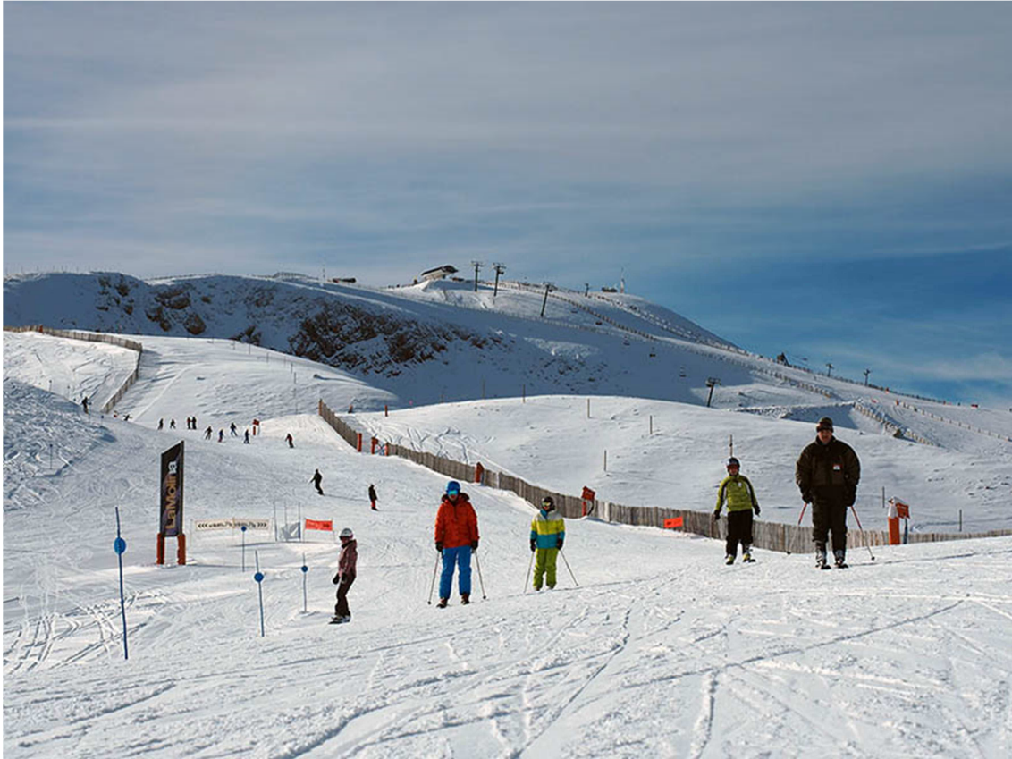
Imagen de archivo de la pista Dues Estacions en el dominio Alp 2500