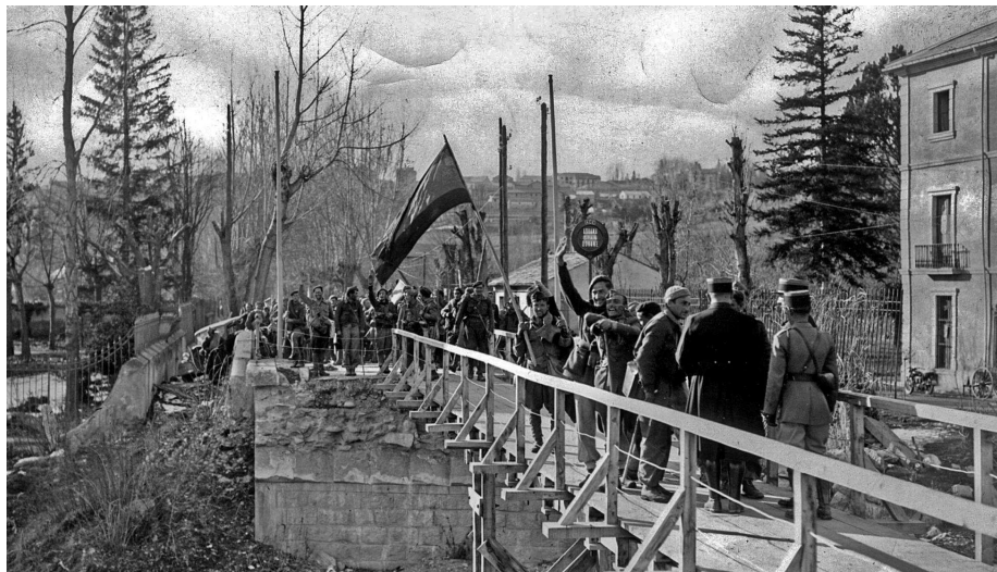
Tropes franquistes el febrer de 1939 a Bourg-Madame.