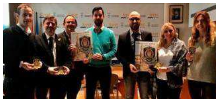
La policia de Lloret de Mar també s'ha unit a la campanya.

El que va començar sent una petita iniciativa local per recaptar fons per a la lluita contra el càncer infantil, s'ha convertit en una gran allau de solidaritat. La campanya Escuts Solidaris, impulsada per la policia de Caldes de Malavella i la de Sant Celoni a principis de desembre, ja porta recaptats més de 80.000 euros i, de moment, s'hi han implicat 42 policies de tot Catalunya.