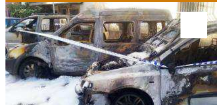
Cotxes cremats a Figueres