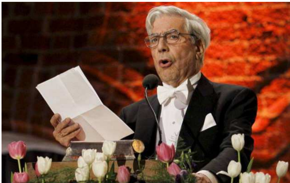
Vargas Llosa llegint el seu discurs d'acceptació del Premi Nobel (2010)

“Sólo un idiota puede ser totalmente feliz”