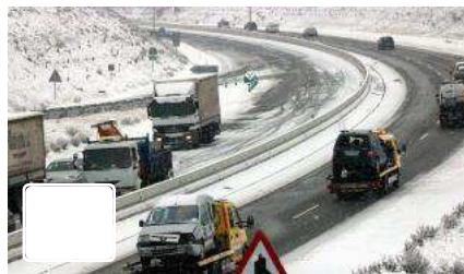
Reobren l'A-2 que ha estat tallada més d'una hora entre Caldes i Girona per la neu

Aquesta restricció ha començat pels volts de dos quarts d'onze del matí per la forta presència de neu i per la possibilitat de plaques de gel a la calçada. I cap a les dotze i cinc del matí, ja tornava a ser oberta.