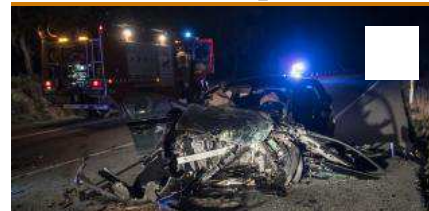
Accident mortal a la Jonquera