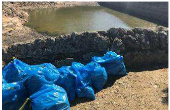
Les bosses de deixalles que es van recollir a la jornada d'ahir al matí.

Ara, cinc mesos més tard, els membres de Sorellona ha aconseguit treure algunes espècies exòtiques de les aigües tèrboles i verdes i en les pròximes setmanes tenen previst extreure el llot acumulat, un pas clau en la recuperació de l'espai. I, sobretot, implicar els veïns de Caldes en tot