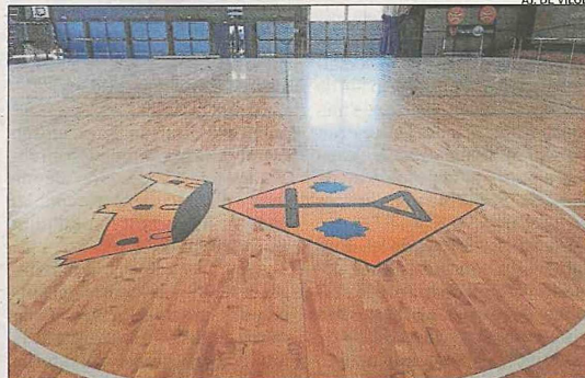
AL DE VILOBÍ

► El pavelló de Vilobí d'Onyar ja torna a estar obert al públic, després de les obres de millora iniciades al febrer passat. La principal actuació va consistir a instal·lar parquet a la pista d'aquest equipament municipal, que era de formigó. També es va habilitar una sortida d'emergències o posar detectors de fum. D'aquesta manera, el pavelló ja pot tornar a acollir les activitats com vòlei, zumba o bàsquet, que ara es feien a Sant Dalmaí.