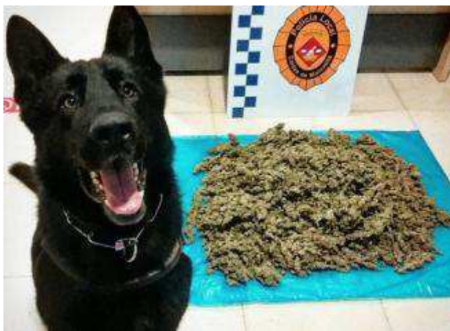
En Drako va detectar la fortor de marihuana a Caldes. polícia local de Caldes

En mirar a l'interior de la bossa, van descobrir que l'home, veí de Girona, portava 1.800 grams de marihuana . Va ser detingut i posat a disposició judicial.