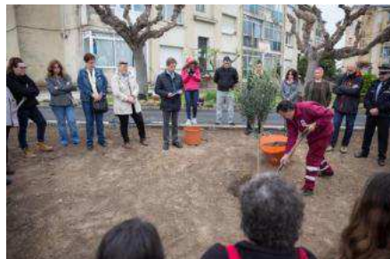
L'equip de govern, veïns i familiars de les víctimes de l'explosió, en el moment de plantar l'olivera com a símbol, davant els edificis del butà. david aparicio

Si preguntes a la gent gran de Caldes de Malavella pels «pisos del butano », no n'hi ha haurà ni un que no sàpiga indicar-te on són. Tothom els coneix més per aquest nom que pel seu propi, que és el de Grup Nostra Senyora de la Llum. Als 70 es van construir aquests habitatges per allotjar precisament els treballadors de l'empresa d'envasament de butà del costat. Vint anys després, una terrible explosió de gas propà en l'edifici va acabar amb la vida de cinc persones i va deixar set ferits, dos d'ells greus. Ahir va fer 25 anys d'aquesta desgràcia que encara perdura dins la memòria de la gent de Caldes.