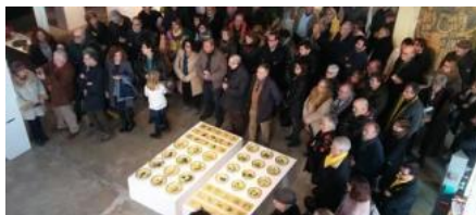
La sala d'exposicions temporals del Terracota Museu es va

L'obrador bisbalenc Vilà Clara Ceramistes va inaugurar ahir l'exposició temporal De Vilà Clara a Vilà-Clara a la sala d'exposicions temporals del Terracota Museu. L'acte, celebrat a les dotze del matí, va ser presidit per Lluís Sais, alcalde de La Bisbal, i va comptar amb l'actuació de la formació bisbalenca Tres i no res.