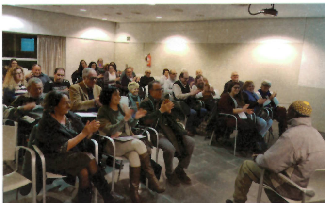
Ritmes africans

I quina millor manera que ballant a ritmes africans per començar el lliurament dels fons de l'Ajuntament de Blanes a 12 projectes de cooperació? Massibe, un jove de Gunyurkuta –localitat gambiana molt propera a Kuwonku–, va oferir una mostra de percussió i, per indicacions del propi intèrpret, més que escoltar es tractava de ballar, una