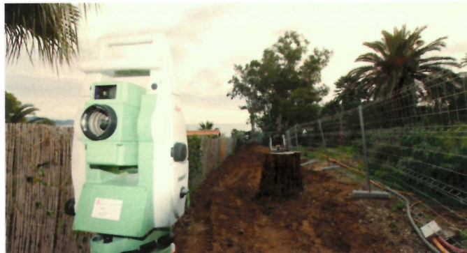
Obres al nou tram del camí de ronda