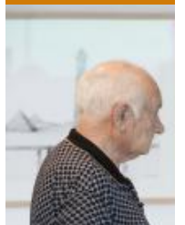
Primers visitants a Julià de Ramis