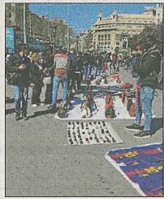
Diversos manterers a la plaça de Catalunya

Els agents han pogut determinar que el grup treballava de manera coordinada i que cadascuna d'elles tenia unes funcions i rols concrets per cometre "amb èxit" els robatoris. Les dones es vestien com turistes per passar desapercebudes i evitar qualsevol sospita entre les persones que acabaven sent les seves víctimes. ■ REDACCIÓ