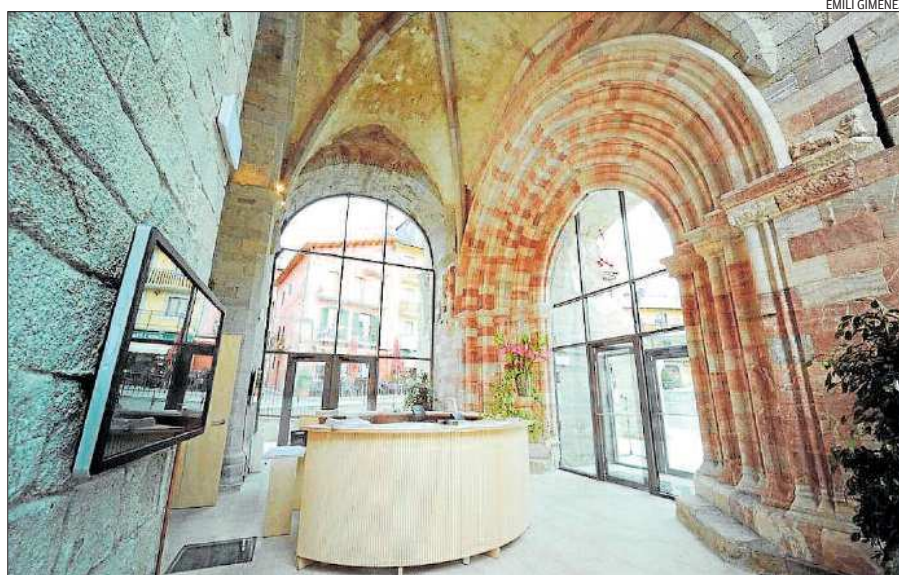
L'Oficina de Turisme creada a l'espai inferior del campanar entre les arcs gòtics fets amb marbre d'Isòvol

Les obres per fer l'oficina van comportar una actuació arqueològica