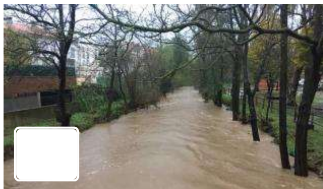
Setze carreteres tallades per la llevantada a les comarques de

Protecció Civil manté activa l'alerta del pla Inuncat per la llevantada que ha fet augmentar el cabal dels rius a l'Alt i Baix Empordà, Gironès i la Selva. Fins a les dues del migdia el telèfon d'emergències ha rebut 437 trucades derivades del temporal. Les comarques des d'on s'han fet la majoria de trucades són l'Alt Empordà 104; el Baix Empordà 88; el Gironès 86; la Selva 73; el Maresme 29 i el Pla de l'Estany 15. Per municipis destaquen Llagostera 27; La Bisbal d'Empordà 25; Figueres 22; Blanes 22; Caldes de Malavella 20; Vilafant 18 i Girona 15. D'aquestes trucades, els Bombers de la Generalitat han atès 265 serveis relacionats amb les pluges entre les vuit del vespre de dissabte i les