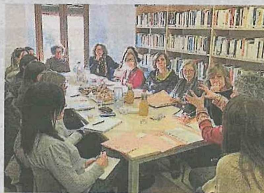
BIBLIOTECA DE BLANES

“Les biblioteques SELVAtges (comarca de la Selva) ens hem plantejat la possibilitat de deixar de folrar els llibres. És la nostra manera de millorar el medi ambient”