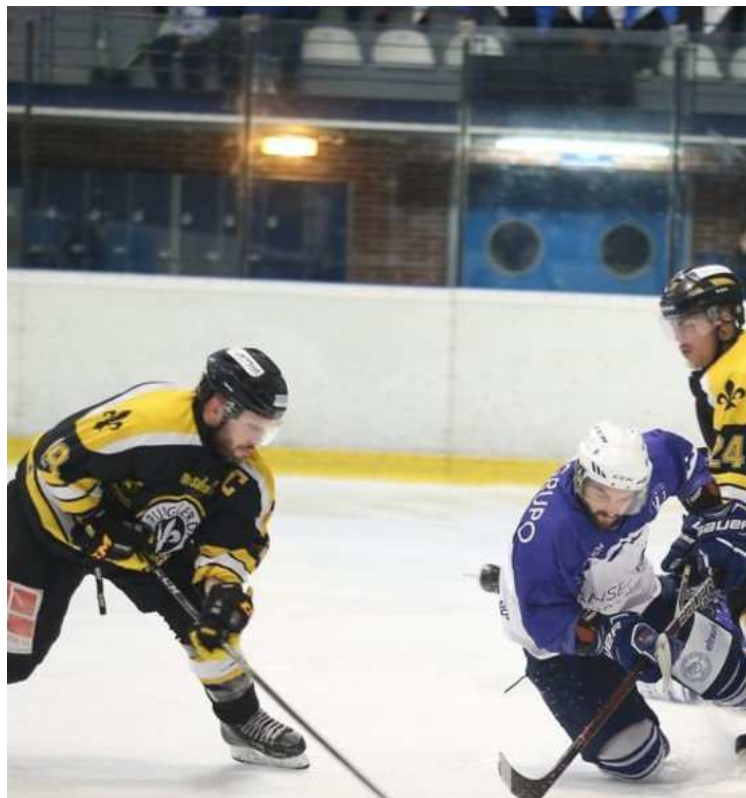
Jugada del cinquè partit de la final FCEH.