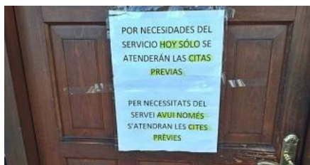
L'oficina de la Seguretat Social de la Bisbal, oberta sota mínims

«Per necessitat del servei avui només s'atendran les cites prèvies». Aquest és el missatge que hi havia ahir a l'entrada del Centre d'Atenció i Informació de la Seguretat Social (CAISS) de la Bisbal d'Empordà, que està obert sota mínims per manca de personal .