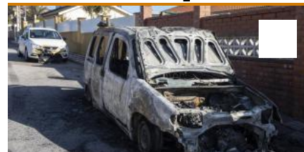
Incendi de vehicles a Caldes de Malavella