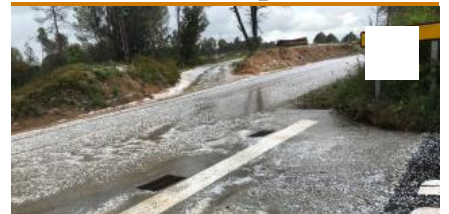
Pedregada a diferents punts de les comarques gironines