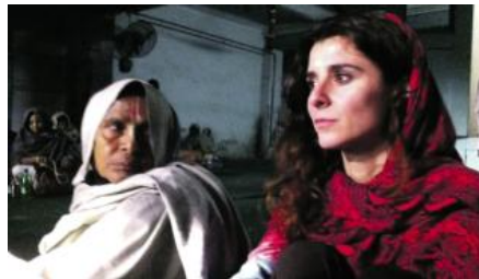
"A Vrindavan s'apleguen unes 20.000 vídues, sense dret a res, vivint de l'almoina" diari de girona