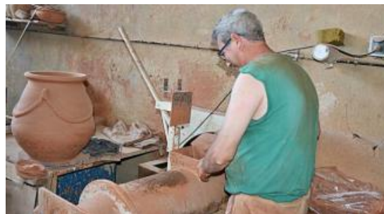
Un operari treballant en una peça en un taller de la Bisbal

Els productors de ceràmica de la Bisbal d'Empordà exporten més del 90% dels articles que fabriquen. Això és com a conseqüència de la caiguda de la demanda que han tingut de les botigues locals, que ha obligat el sector a «reinventar-se» i fer peces «exclusives» que venen a l'estranger.