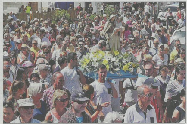
► CELEBRACIÓ DE LES FESTES DEL CARMÉ A LA COSTA BRAVA. 1 La processó de l'Estartit, que es va fer a partir de les sis de la tarda. 2 A l'Escala, la festa del Carme va estar acompanyada, com cada any, de l'homenatge a la Vellesa. 3 Un moment de la celebració a Empuriabrava, on la processó es fa pels canals. 4 L'ajuntament de Castelló d'Empúries 4 La processó de Llançà d'ahir al matí va ser, un any més, multitudinària.

Castelló. A més, els assistents també van poder ballar sardanes amb la cobla Rossinyolets i la cobla Castellonina. Posteriorment, ja cap a les vuit del vespre i també a la plaça de les Palmeres, van tenir lloc la benedicció i els cants a la Verge del Carme, seguits d'una sardinada popular i havaneres amb el grup Son de l'Habana. Finalment, a partir de les deu de la nit, es va organitzar un ball amb l'orquestra Nueva Alaska, que va donar pas a l'espectacle piromusical amb castell de focs, que va clausurar la jornada.