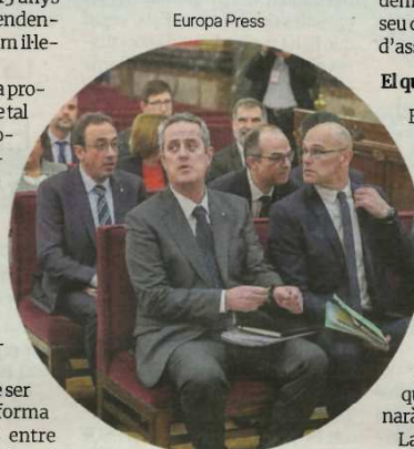
Els líders independentistes, en la primera jornada del judici, el 12 de febrer del 2019.

Les altres preguntes es dirigeixen a determinar si els demanants d'empara van ser condemnats quan exercien legítimament els seus drets a la llibertat d'expressió i d'associació, o si s'ha violat l'article 5 del conveni pel seu empresonament. ■