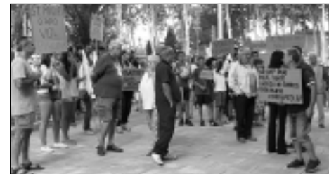
Veïns de la urbanització davant de l'Ajuntament.