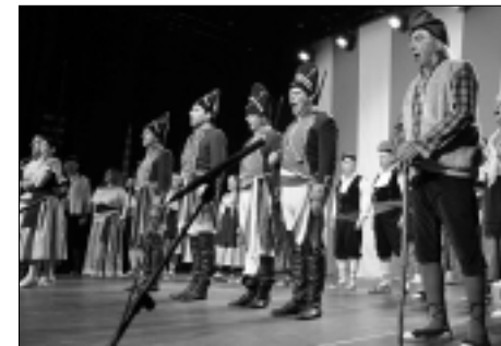
Una escena final de Cançó d'amor i de guerra .