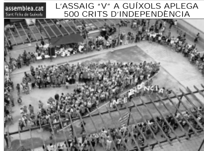
assemblea.cat Sant Feliu de Guíxols

Aquest reforç escolar (Sie) a nens i nenes de les escoles de Sant Feliu es desenvolupa d'octubre a maig als locals de Càritas al costat de l'església de Santa Maria i és possible gràcies a la col·laboració de voluntaris-es que dediquen unes hores del seu temps a aquesta activitat. Sempre es necessiten persones de qualsevol edat pel Sie. Si hi ha algú interessat en col·laborar el proper curs (sigui un dia o dos a la setmana) pot posar-se en contacte amb Càritas de Sant Feliu (Tels. 972 321782 o 686 366397). / CÀRITAS SANT FELIU.