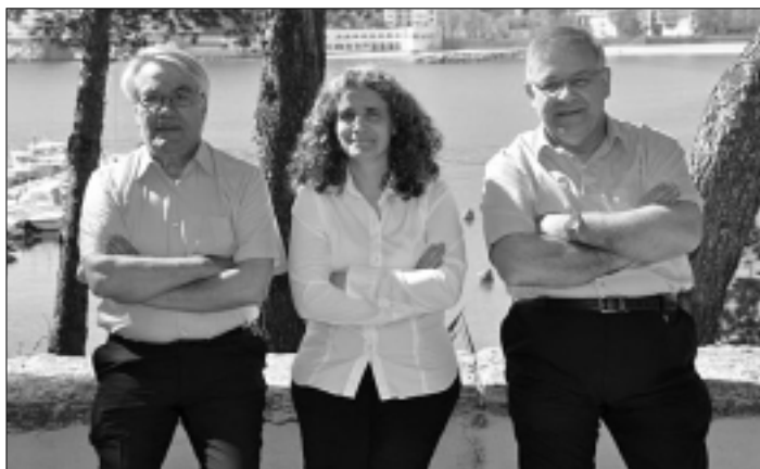
GRUP LA TAVERNA

En escoltar el compact disc "ES PETIT BARQUET", les seves cançons m'han provocat una entranyable travessia imaginària per aquesta costa que m'esquitxa de records d'infant.