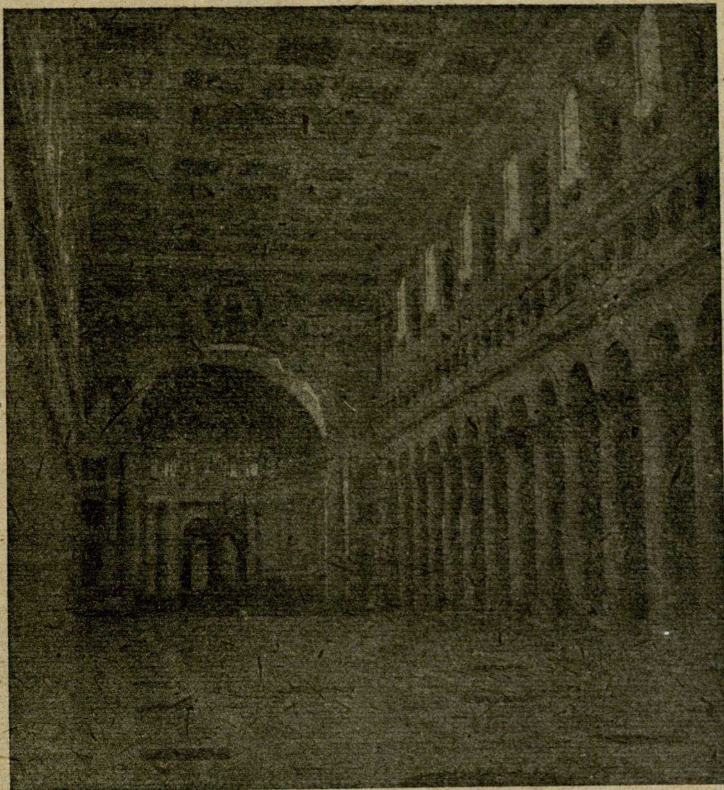
Interior de la Basílica de Santa María la Mayor

nífico lienzo de Jesús Crucificado, de Sicciolante, y en una estancia contigua el sepulcro del Cardenal Montoya, de Bernini.