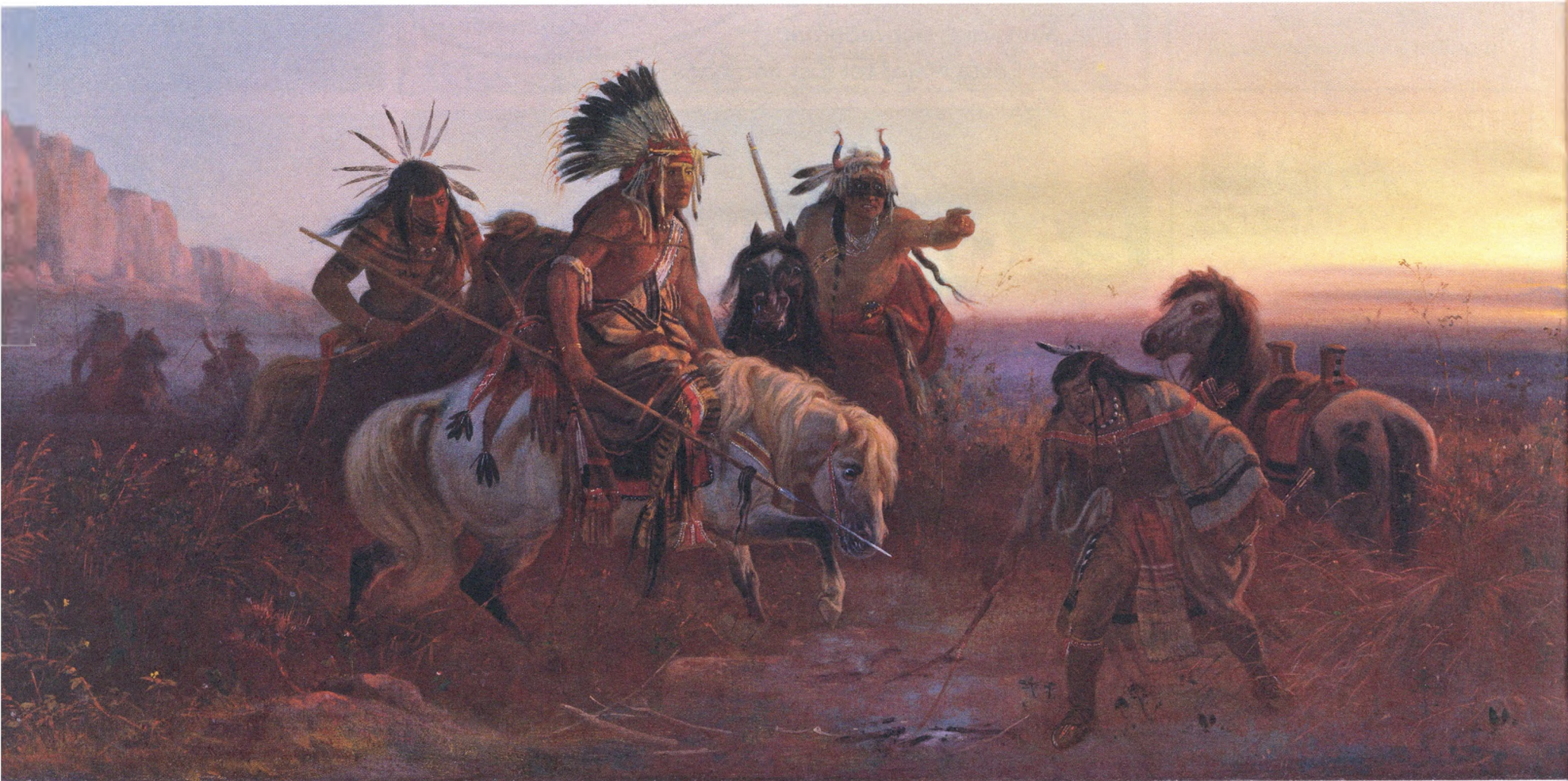
Charles Ferdinand Wimar. El rastre perdut , c.1856 Oli sobre tela, 49,5 x 77,5 cm. Museu Thyssen-Bornemisza, Madrid

Del 25 de juny al 30 d'octubre 2016 Monestir de Sant Feliu de Guíxols