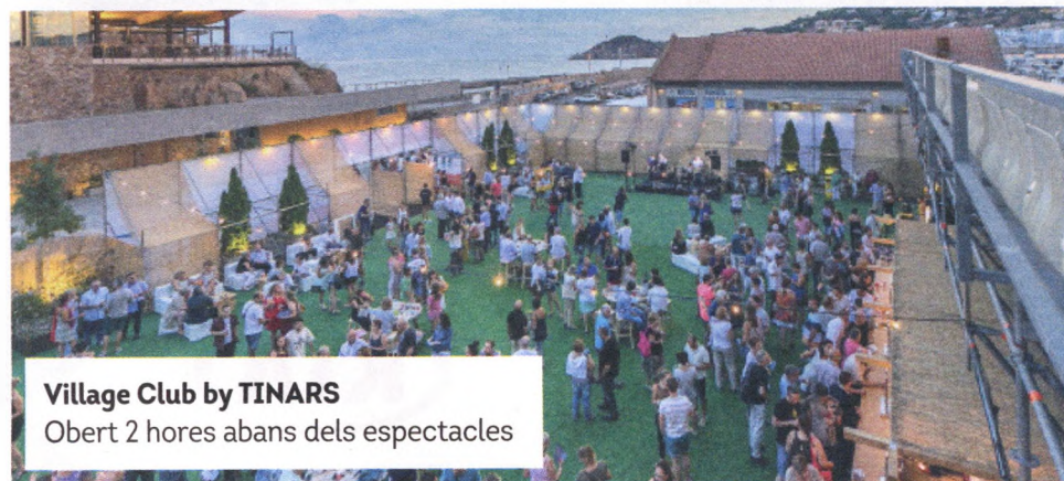
Village Club by TINARS Obert 2 hores abans dels espectacles