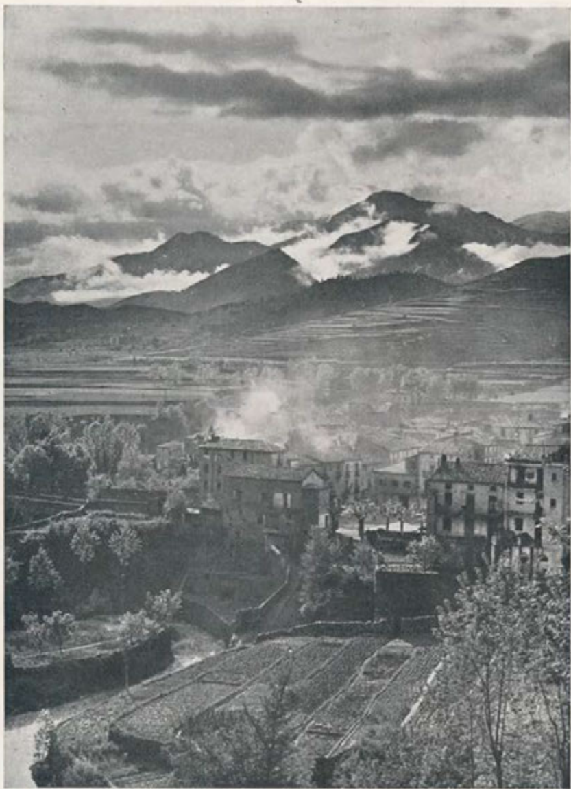
«Llum de pluja sobre la vila»