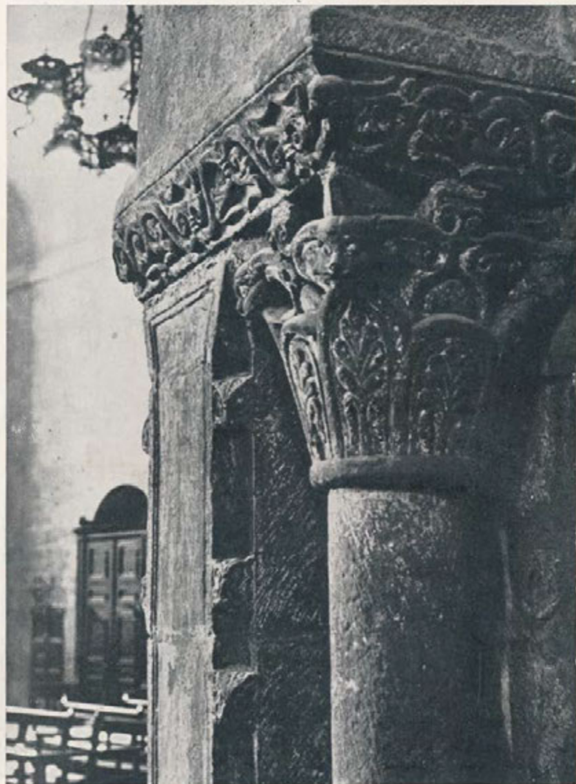
•El Monestir des de la duresa d'un angle•