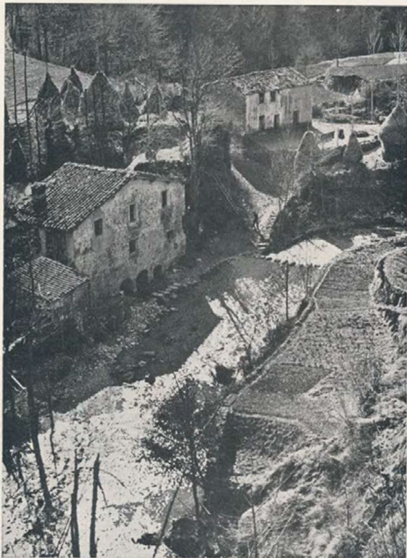
•El molí petit, clarós com una cançó•