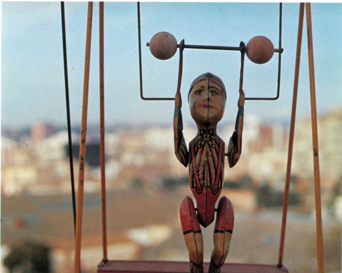
TRAPEZISTA, 1920 Fabricant desconegut Llauna litografiada 19 x 40 x 24 cm