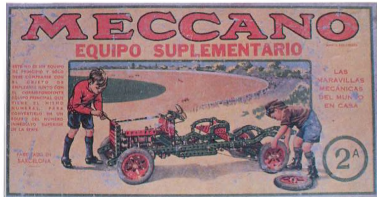
MECCANO, 1932 Poch, Barcelona Peces metàl·liques pintades 35 x 22 x 3,5 cm