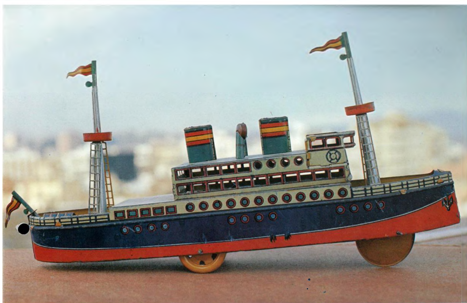
TRANSATLÀNTIC, 1935 Germans Payà, Ibi (Alacant) Llauna litografiada 33 x 19 x 7,5 cm