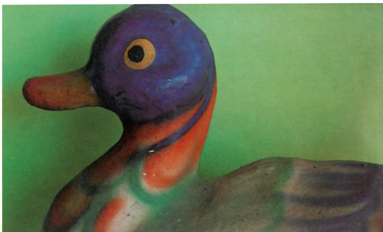
ÀNEC, 1930 Pasqual, Santa Maria de Barberà Cartró pintat 29 x 26 x 18 cm

Quan la Generalitat de Catalunya, a través del Servei d'Arts Plàstiques del Departament de Cultura, em va comunicar el seu desig de realitzar una mostra itinerant amb algunes peces del Museu de Juguets* de Figueres, ens vàrem sentir molt honorats els joguets i jo, i immediatament vàrem acceptar complaguts.