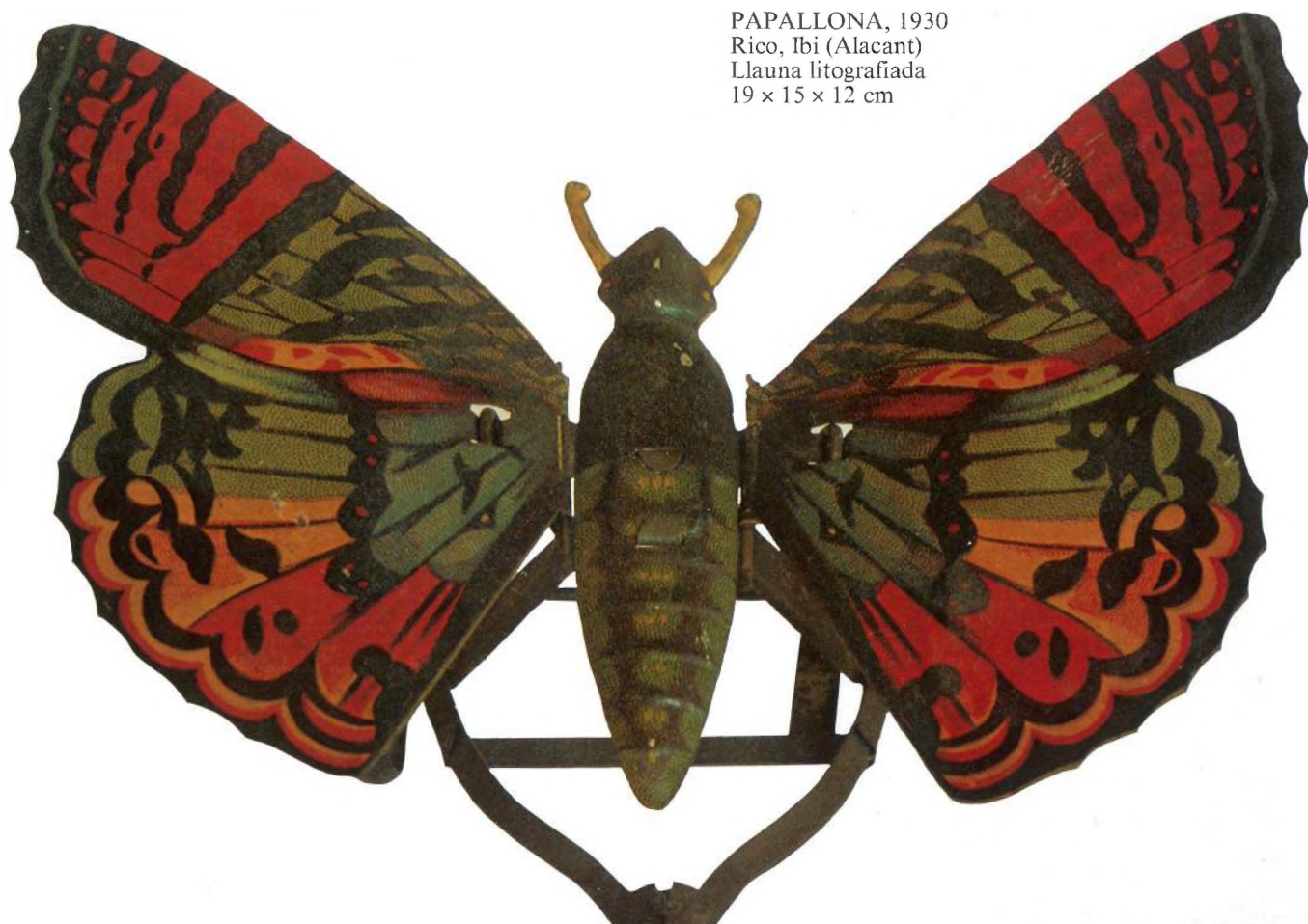
PAPALLONA, 1930 Rico, Ibi (Alacant) Llauna litografiada 19 x 15 x 12 cm

Incalculables hores de felicitat i de descobriments produïren en els nens de la seva època que pogueren gaudir d'algun d'ells. Ara, demanen en la seva contemplació un agradable esforç d'imaginació. I darrera de cadascun d'ells, un món per descobrir, el món dels nens i de les nenes del seu moment, el món dels homes i de les dones que són ara.