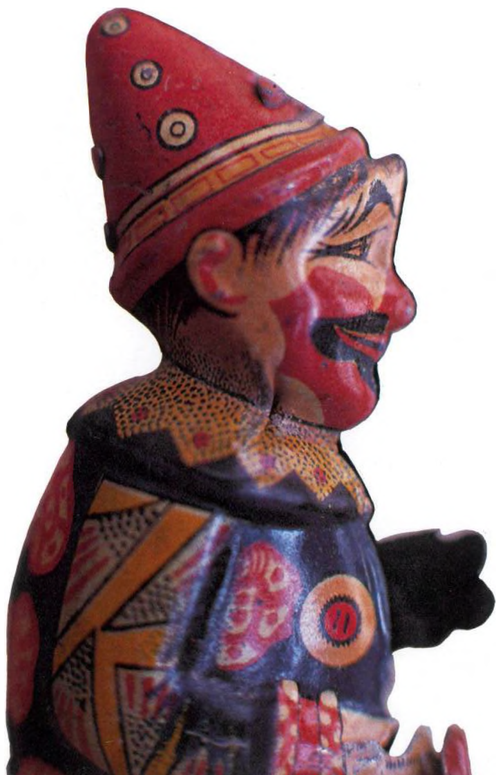
PALLASSO, 1930 Germans Payà, Ibi (Alacant) Llauna litografiada 23 x 14 x 8,5 cm

* El mot joguet és el sinònim de juguina usat a l'Alt Empordà i al Rosselló i també, tal com ens confirmà per carta l'il·lustre filòleg F. de B. Moll, a diverses zones del País Valencià.