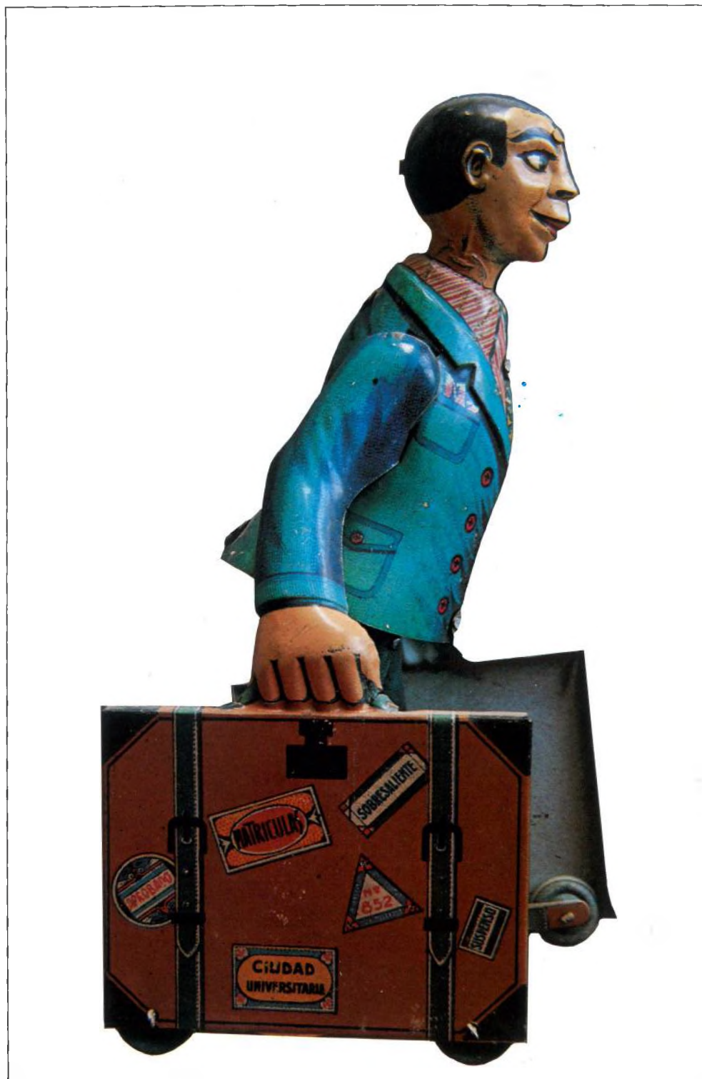
ESTUDIANT, 1930 Germans Payà, Ibi (Alacant) Llauna litografiada 9 × 18 × 8,5 cm