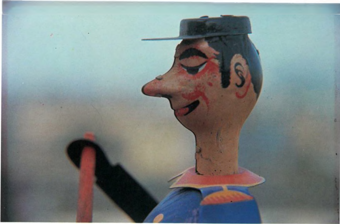
ESCOMBRIARE, 1930 Germans Payà, Ibi (Alacant) Llauna litografiada 19 x 19 x 8 cm