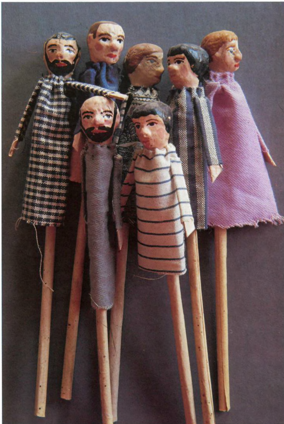
TITELLES L.R.M., 1900 Utilitzades en un teatre retallable de Paluzie, Barcelona Cartró i guix pintat 16 cm