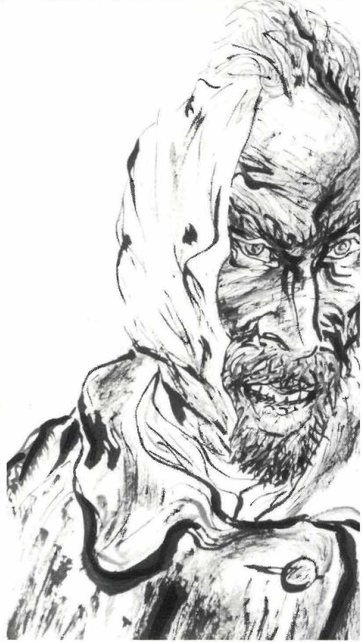
EL SOMRIURE DE VINCENT (dibuix)