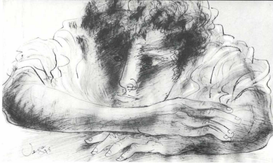
NOI PENSATIU (dibuix)