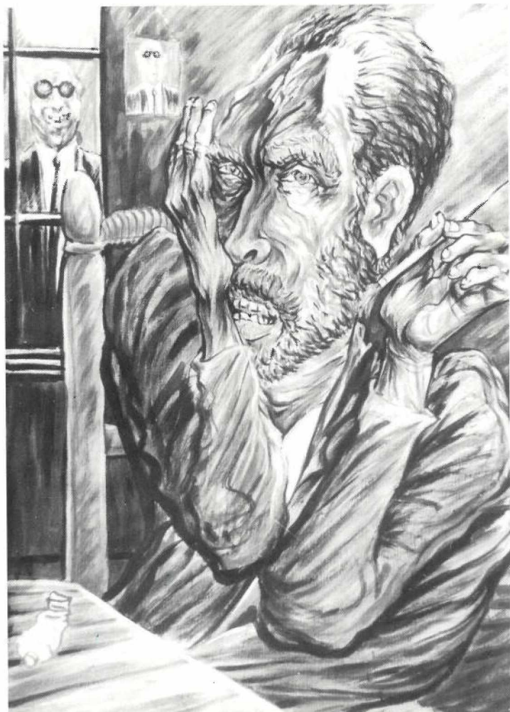
EL DUBTE (cera)