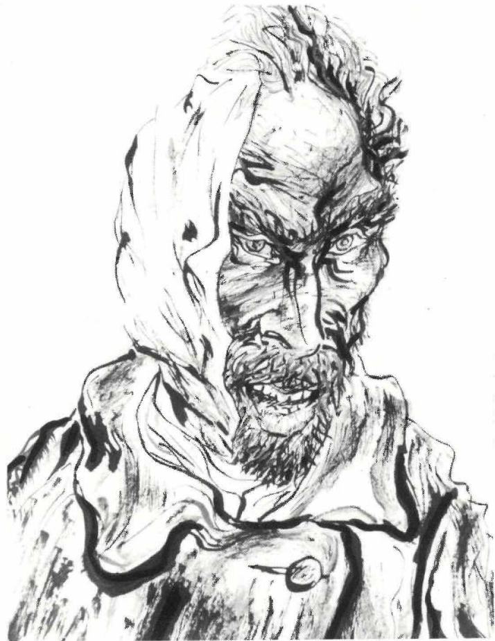
EL SOMRIURE DE VINCENT (dibuix)