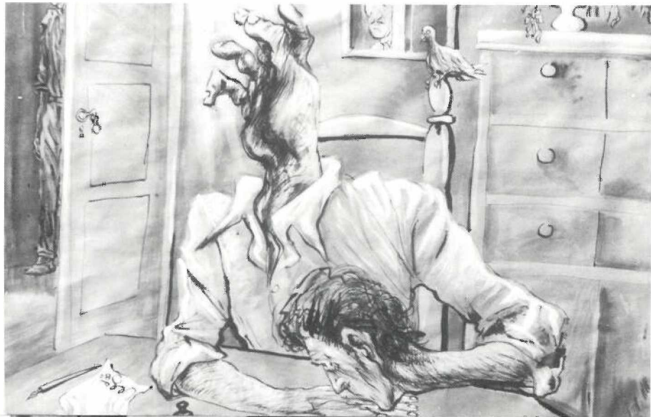
EL QUE DIBUIXA AMB EL CAP (tinta i tèmpera)