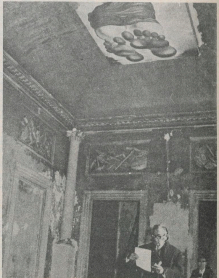
El "diví" dirigeix les obres del seu museu. Al sostre, el fresc "El Palau del Vent" comença a tenir vida.

ble fecha del sábado, día 28 de septiembre, en medio de gran jolgorio y expectación, en unos actos presididos por el vicepresidente primero del Gobierno,