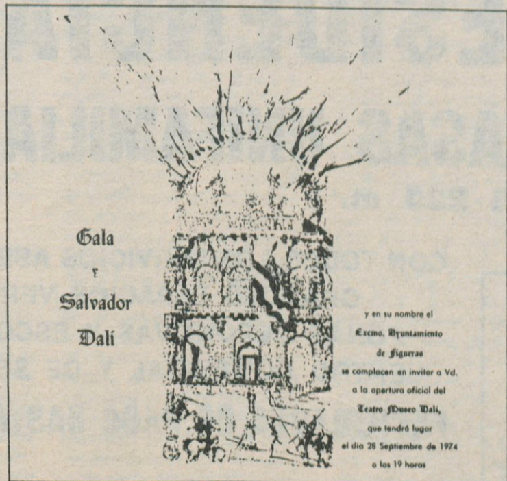
Invitació de la inauguració del Teatre-Museu