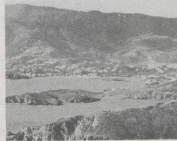
El Cap de Ras. Al fons, Llançà.