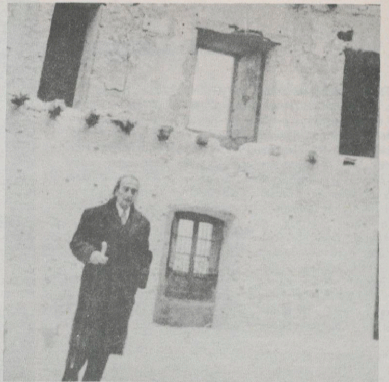
Dalí contempla les ruïnes del Teatre Municipal, abans de començar les obres de restauració.

Una d'elles, que representava la musa Terpsicore (Deessa del Ball), fou "protestada" per la seva "semi nuesa", en la qual alguns, en lloc d'endevinar-hi una manifestació de caràcter