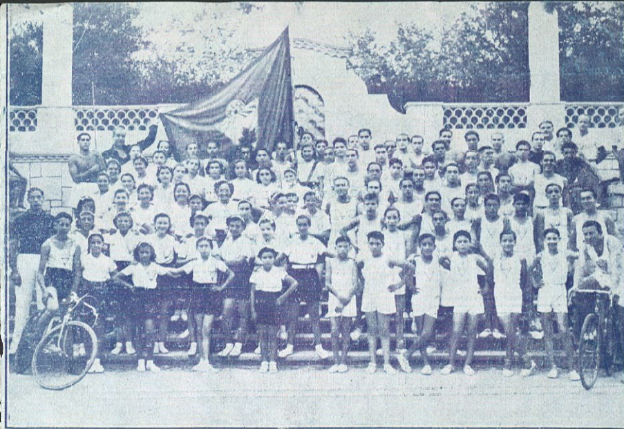
Grup de la Secció de Gimnàstica i Atletisme que participà en el 1. er festival Pro Hospitals organitzat per l'A. E. E. P. A. després del 19 juliol del 1936.