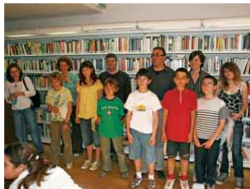
Lliurament de premis del concurs del Premi de Microliteratura de l'any passat.