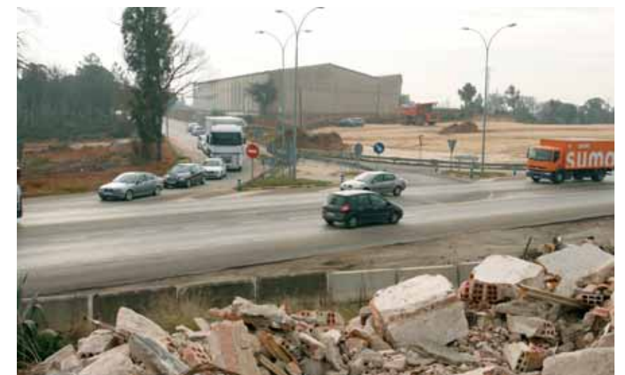
Accedir a l'NII continua sent difícil. En primer terme, les runes dels Tapiots. Al fons, els treballs del tram entre Caldes i Sils.

quatre carrils -dos per a cada sentit de la marxa- en la qual es pot circular a 120 quilòmetres per hora, una carretera que comença just després de l'enllaç amb el camp de PGA Golf de Catalunya i acaba a pocs metres de l'entrada de la variant de Girona. Des que es va inaugurar, els operaris han continuat treballant en l'adequació dels accessos a l'aeroport i a Riudellots de la Selva; així com també en la col·locació dels elements d'il·luminació de la carretera. Pel que fa a l'extrem situat a Fornells de la Selva, el Ministeri de Foment no ha resolt la incorporació a l'autovia des de Girona, mantenint un cedeixi el pas complicat.