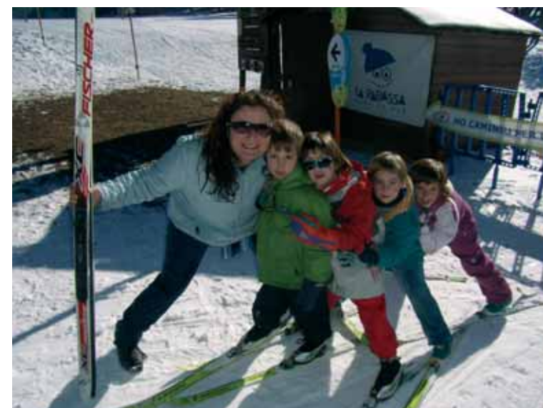
La Irene i uns quants petitons