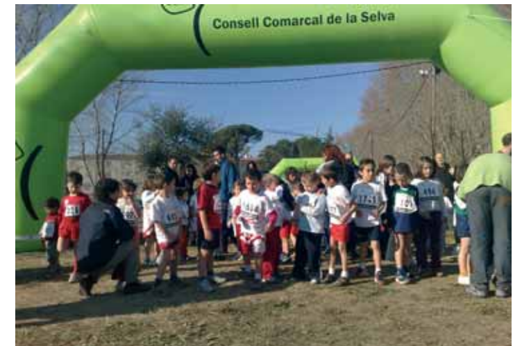
...i alguns menuts de Caldes