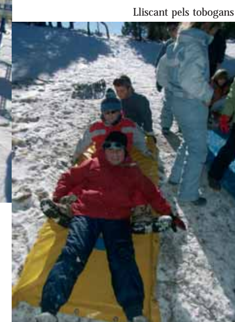
Lliscant pels tobogans