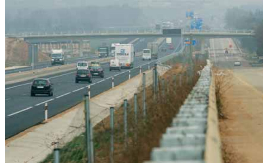
El tram nou d'autovia a l'esquerra, a la dreta, la carretera vella que ara serveix d'accés a Franciac i al fons, el pont de Franciac.

Caldes i Sils i 14,7 més per continuar l'obra fins a Maçanet de la Selva. El mateix dia que tallava la cinta per obrir simbòlicament la nova carretera, la ministra va manifestar que el següent tram que afecta Caldes entrarà en funcionament abans d'acabar el 2008. És cert que els treballs ja han començat però, en vistes dels antecedents, costa creure's aquest calendari. I sinó recordem els fets: dirigents del PP van posar la primera pedra de la recent estrenada autovia el març de 2004, just abans de les eleccions que va guanyar el PSOE. Llavors, els populars van anunciar que la carretera s'enllestiria en dos anys, però ha tardat el doble i s'ha acabat precisament a les portes d'unes noves eleccions generals. Per justificar aquest retard de dos anys, la ministra de Foment va culpar l'administració anterior dient que els socialistes es van trobar amb les obres per començar i que els diferents estudis informatius del projecte estaven endarrerits. Ja referint-se al seu mandat, Álvarez va afegir que els treballs havien estat molt complexos.