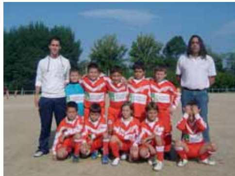
Equip benjamí B