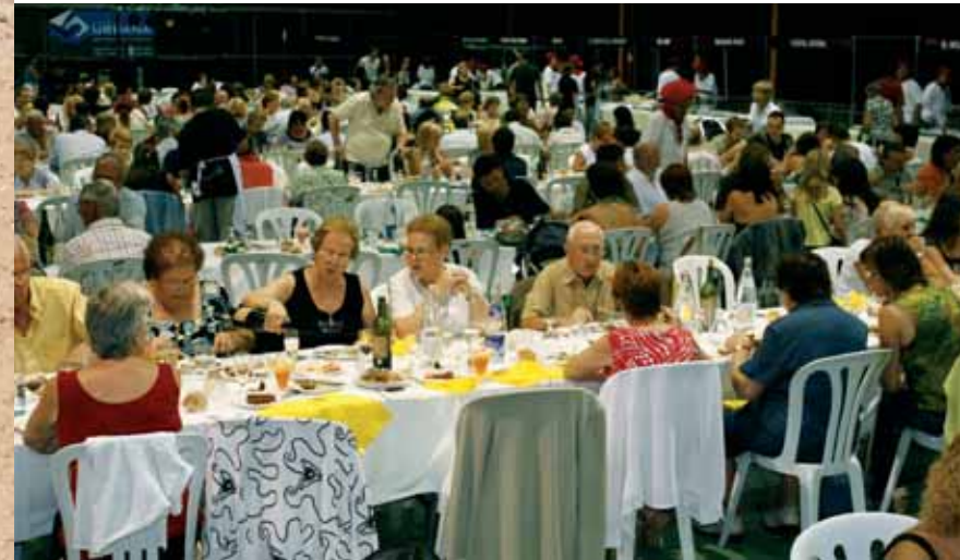
La Primera Mostra Gastronòmica celebrada durant la Festa Major

El 4 d'octubre de 2004 va ser creada l'Associació de Comerç i Serveis de Caldes de Malavella. Els objectius de l'Associació són la representació, defensa i promoció dels interessos econòmics, socials, laborals, professionals i culturals dels seus afiliats; el foment de la solidaritat dels associats afiliats promocionant i creant serveis comuns; la dinamització comercial del poble i la millora constant de la informació i formació dels associats.