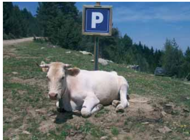
2n. premi, per a la família Pera-Aulet