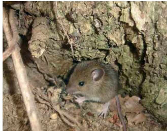
3r premi, per a la família Bermúdez-Bartomeu