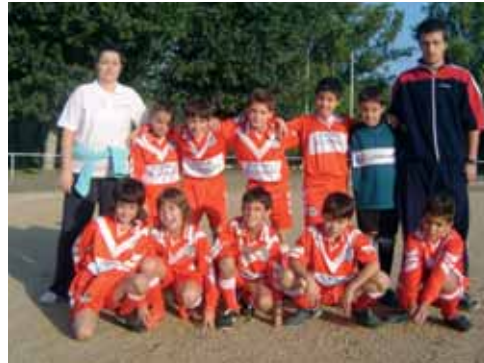
Equip benjamí A

Els benjamins A, acaben també una bona primera fase, guanyant 4 partits i perdent els dos jugats contra el CE Anglès, que enguany ha muntat un equip molt potent. La qualitat dels