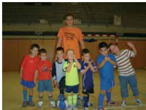
Equip de l'escoleta

jugadors ens fa pensar que també disputaran una bona segona fase.