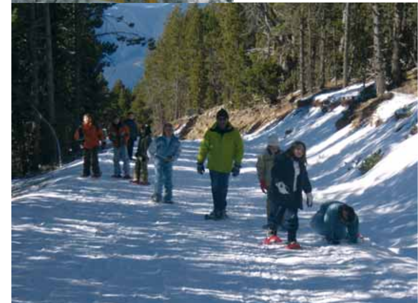
Primeres passes amb esquís