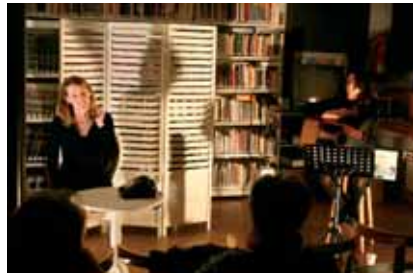
Contes de Dorothy Parker