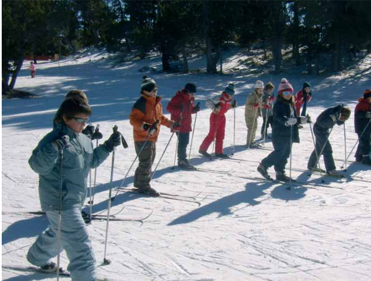
Caminada amb raquetes de neu