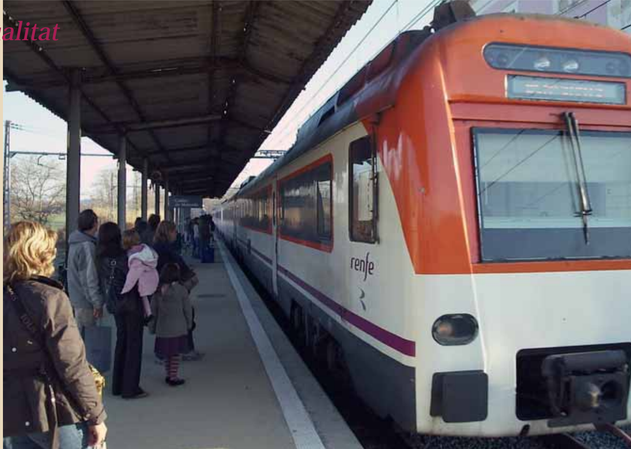
El tren és el mitjà de transport de força caldens i gent de rodalies