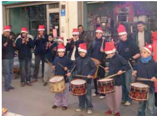
Cagrossos al JAN

El diumenge 23 de desembre, la Colla Gegantera de Caldes vam celebrar les festes nadalenques amb el tradicional Brindis de Nadal. Ens vam reunir tots al Casino on vam poder veure un reportatge fotogràfic de totes les sortides del 2007, vam aprofitar la instal·lació per veure el partit del Barça -Madrid i vam prendre un petit i boníssim refrigeri. Per primer any vam jugar al QUI ÉS QUI?. El joc consistia en que tothom portava una foto de la seva infantesa i els altres l'havíem de reconèixer. N'hi ha que no van poder amagar qui eren o de qui eren fills i d'altres encara no els hem descobert. Va ser d'allò més divertit. I per acabar, el brindis amb els millors i gegants desitjos per al 2008.