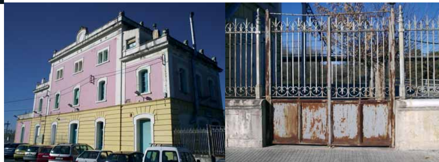
Vista de la façana per la part de la placeta

Les millores no s'acaben aquí ja que, com dèiem, es preveuen tres projectes diferents, l'execució dels quals pot coincidir en el temps. El primer és un projecte de remodelació integral de l'estació, el segon és una millora de les vies i andanes que afectarà el tram gironí de la línia i per últim un esperat aparcament definitiu al costat de l'estació.