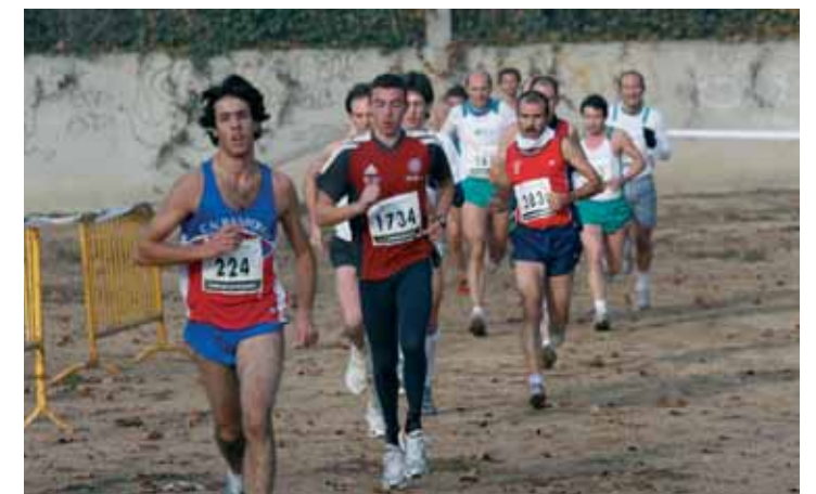
En plena cursa