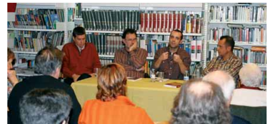
Presentació del llibre el 23 de gener