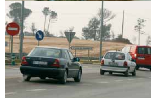
Vehicles intentant trencar per anar cap a Caldes

Sigui com sigui, els caldencs no tenim altre remei que circular per la N-II, tant per anar en direcció a Girona com a Barcelona. Durant els quatre anys d'obres, i sobretot en la fase final, els conductors han hagut de superar una mala senyalització dels desviaments provisionals -que en els últims mesos canviaven d'un dia per l'altre-, una il·luminació pèssima, entrades i sortides de camions mal indicades o retencions que agreujaven les cues habituals. A aquestes molèsties s'hi ha d'afegir la perillosa cruïlla de la N-II amb la carretera que porta fins a Caldes on, a més, des de fa setmanes s'ha ubicat un punt d'accés dels camions que treballen en el nou tram. Al desembre, alertats pel que ha succeït i preocupats pel que ha de venir, tots els partits polítics representats a l'Ajuntament van aprovar una moció reprovant el Ministeri de Foment per la manca de seguretat durant les obres ja acabades i demanant-li que adopti les mesures necessàries perquè la situació no es repeteixi en el desdoblament de Caldes a Sils.