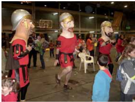
Cercavila de Nades