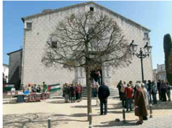
Paradeta a la plaça de l'Església