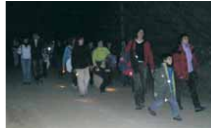
La clàssica sortida nocturna amb sopar final que va comptar amb més de cent participants. Enguany, de Caldes al Moli de la Selva.

Aquest any sis membres del club han participat a la Montserrat-Reus, de 100km, un molt bona mit-