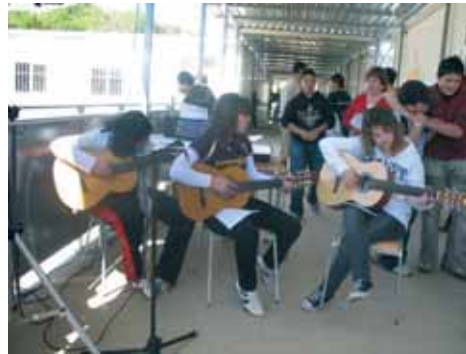
SANT JORDI al Ses Caldes de Malavella

Com que als professors a vegades se'ns acaben les idees, vam decidir donar el protagonisme als alumnes més veterans del nostre centre per preparar les activitats de la Diada de Sant Jordi: els nois i noies de 3r