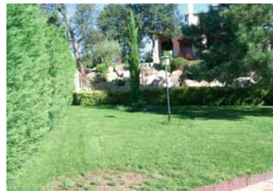
Jardí amb necessitat de cura i molta aigua