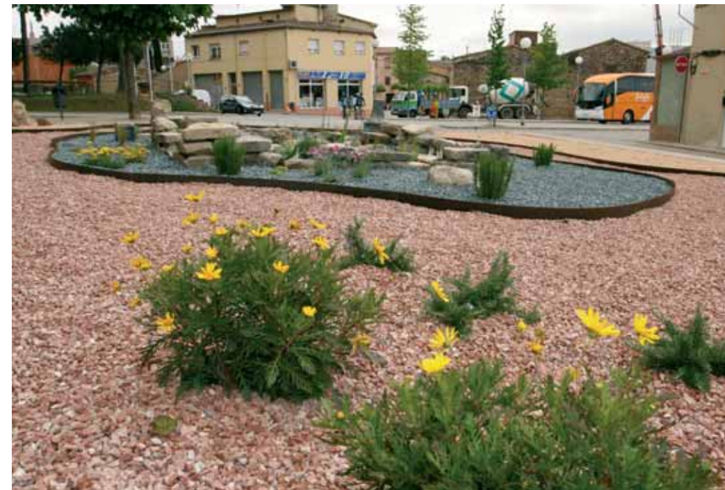
El jardí que l'Ajuntament ha reformat entre el carrer de Girona i la plaça de l'Amical Mathausen

L' aigua està en boca de tothom des de fa uns mesos.