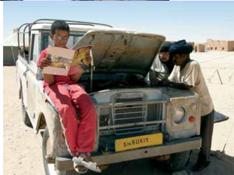
L'Aquae arriba al Sàhara!

L'objectiu de la campanya a Catalunya és la recollida de productes d'higiene personal, per fer-los arribar als campaments de Tinduf (Argèlia). A Caldes s'ha recollit un total de 240.60 kg de material. Podeu veure reflexat en la taula següent les aportacions dels diferents municipis de la nostra contrada.