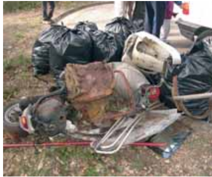
Algunes de les variades deixalles que es van recollir en la Botineteja

El 24 de febrer passat, la Colla Excursionista, amb l'ajuda d'altres entitats van organitzar, com cada