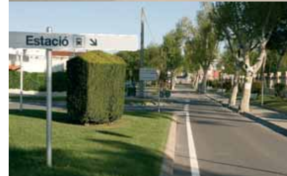
A dalt, Cal Ferrer de la plaça A baix, Avinguda doctor Furest

L'Ajuntament ha aconseguit subvencions per a 6 projectes a través del Pla Únic d'Obres i Serveis de Catalunya (PUOSC). La primera de les obres, que s'iniciarà aquest any, consisteix en les obres d'urbanització de l'avinguda Doctor Furest, que consistirà en ampliar l'espai destinat a la circulació dels cotxes i fer un passeig de vianants, tot respectant els arbres que hi ha actualment. Per l'any vinent es farà la reforma del col·lector de Can Carbonell, mentre que el 2010 es començarà la rehabilitació de Cal Ferrer de la