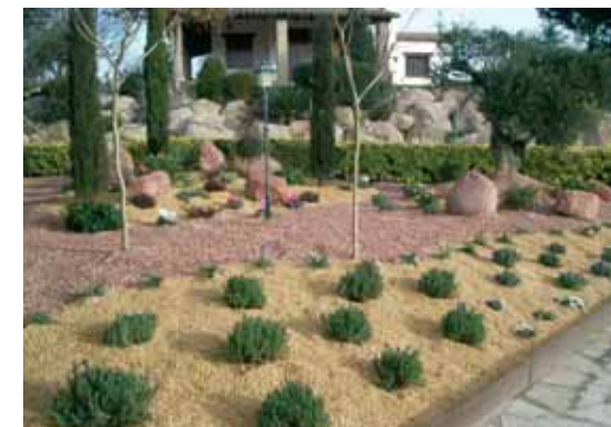
El mateix jardí, ara, sense necessitat de manteniment