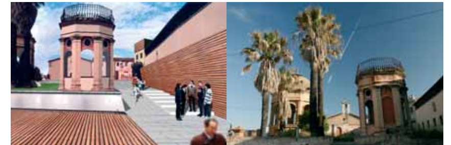
projecció de com serà l'espai

El projecte preveu fer un passeig amb bancs i amb un enllumenat que disposa de peveters que permetran encendre'ls en cas de fer activitats especials, com actes cul-