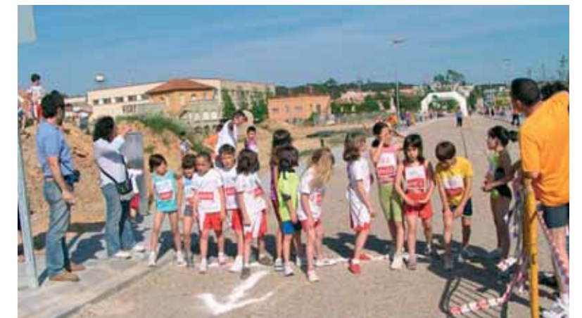
Imatge dels menuts participant en la Milla l'any passat