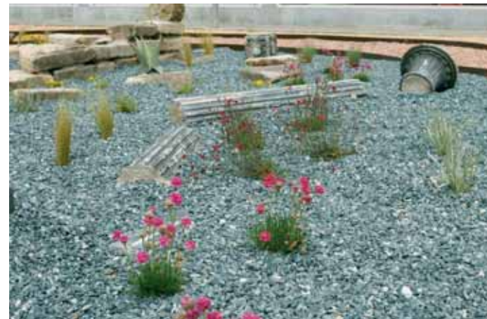
El jardí que l'Ajuntament ha reformat entre el carrer de Girona i la plaça de l'Amical Mathausen