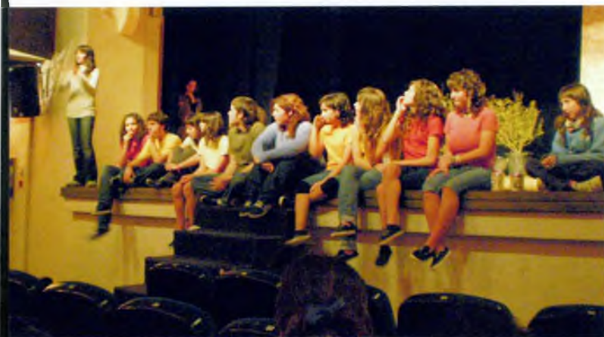
Els actors interrelacionant amb el públic.

Després de rebre el regal, tots els actors van seure al peu de l'escenari i van respondre tots aquells dubtes i curiositats que teníem sobre l'obra. Ells també van aprofitar per fer-nos algunes preguntes i demanar-nos si ens havia agradat. ■