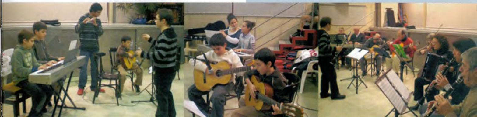
De esquerra a dreta: Quartet de piano, guitarra i flauta travessera / Combo de bateria, teclat, flauta travessera i guitarres / Piano, guitarres, violí, acordió i flautes travesseres

U El dissabte 10 de gener es va fer la primera audició d'agrupacions instrumentals de l'Aula de Música.