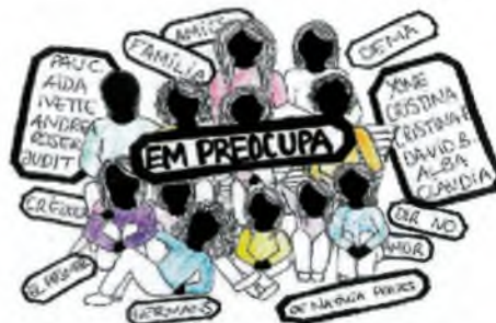
El dibuix identificatiu de l'obra.