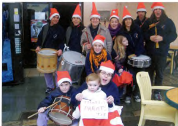
Cercavila de Nadales

Si voleu seguir-nos de més a prop i està informats de les nostres activitats, podeu connectar-vos al nostre web: www.caldesdemalavella.cat/gegants ■