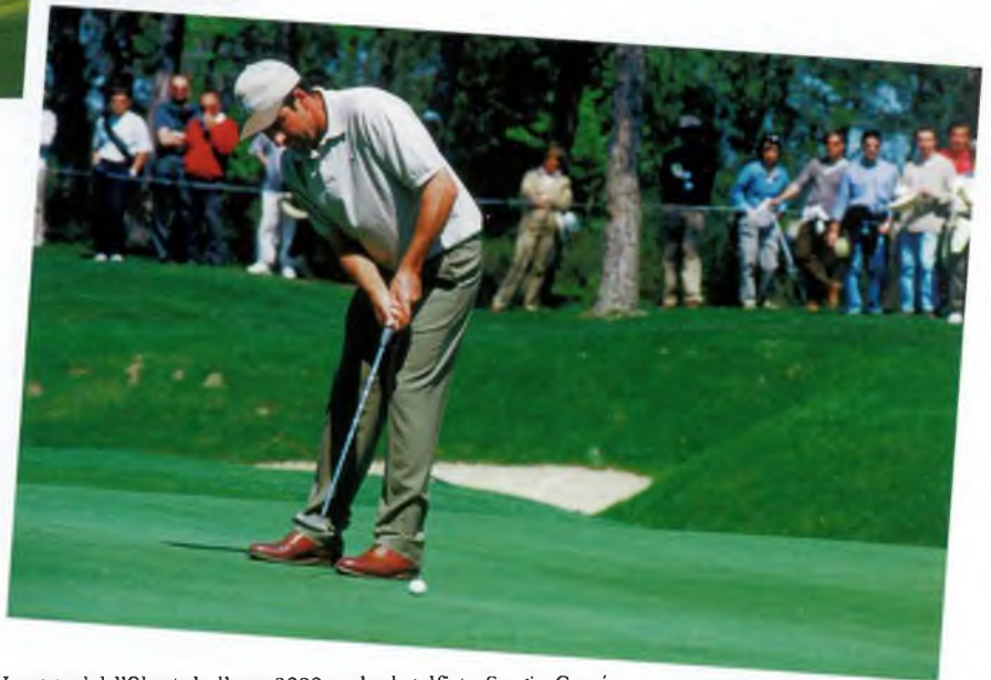
Imatge del l'Obert de l'any 2000 amb el golfista Sergio García

El camp de la PGA Golf de Catalunya acollirà entre el 29 d'abril i el 3 de maig l'Open d'Espanya 2009, que ja s'hi va celebrar durant l'any 2000 amb una assistència de 50.000 espectadors, xifra que encara representa el rècord de públic en un esdeveniment esportiu a les comarques gironines. La competició és la més important dels tornejos de la PGA European Tour