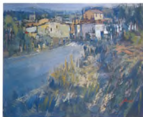
Primer premi de l'any 2008

A hores d'ara ja han confirmat la seva col·laboració els següents patrocinadors: Balneari Prats, Restaurant Riera-Cal Nap, Gabinet de Teràpies Naturals. I es compta amb els ajuts institucionals de l'Ajuntament de Caldes de Malavella, del Consell Comarcal de la Selva i de la Diputació de Girona. Hi trobareu informació detallada a: www.caldesdemalavella.cat/concursdepinturarapida ■