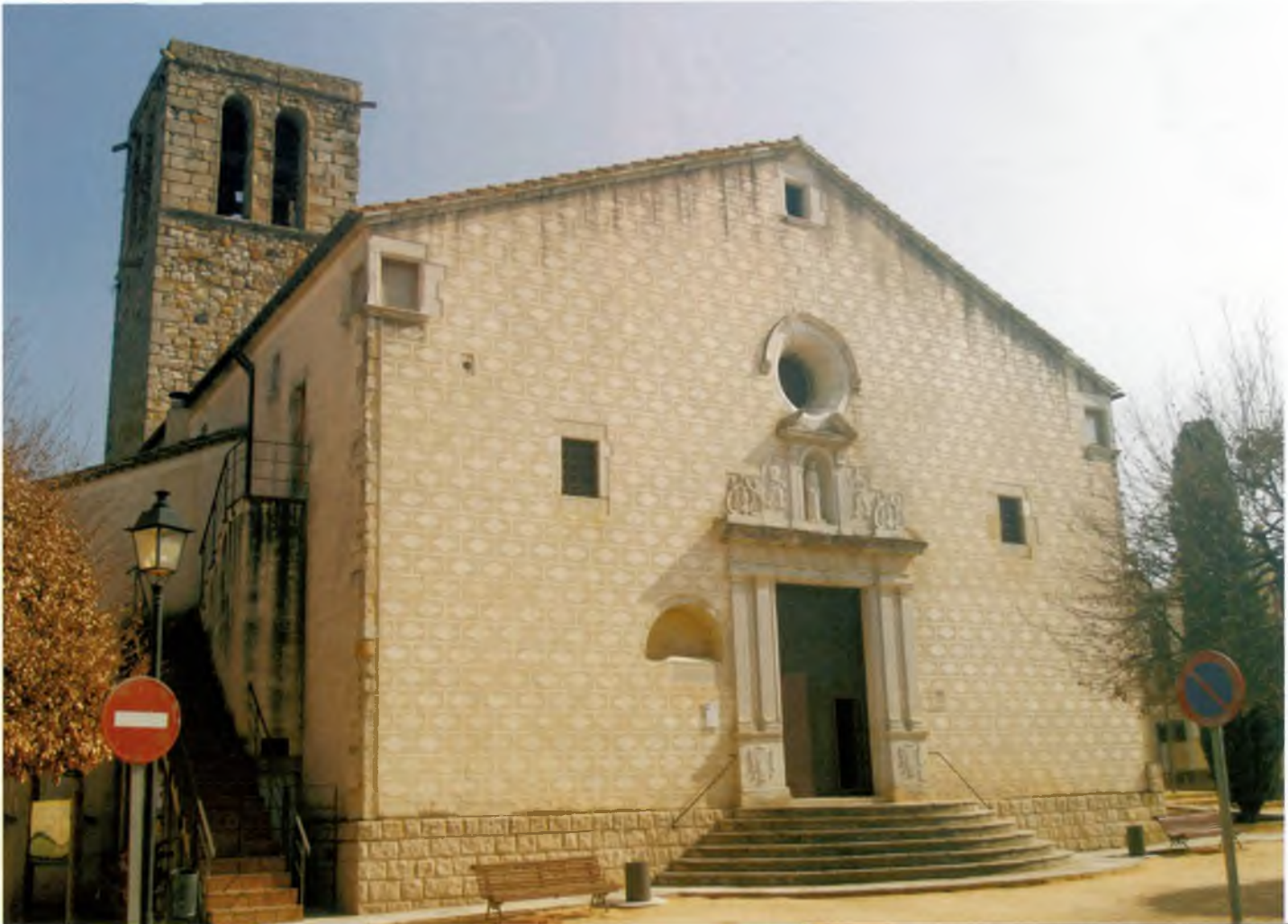
La façana i el campanar

A quest temple religiós actua com a eix vertebrador del casc antic del municipi, erigint-se com una mena d'epicentre per emprendre diversos passejos: cap a la Font de la Vaca o la rambla Recolons passant, per exemple, per la plaça del Mestre Mas i Ros; resseguint les cases d'estil modernista o neoclàssic escampades pel nucli urbà, adreçant-se cap als balnearis; recorrent la zona comercial del municipi; anant en direcció a les Termes Romanes i Sant Grau; o enfilant les Roques per arribar a Can Rufí. Encara que una altra opció ben agradable, especialment durant el bon temps, és asseure's a la mateixa plaça de l'església o jugar amb la mainada al parc infantil habilitat en aquest sector.