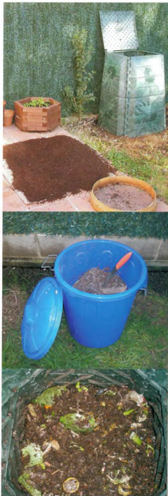
De dalt a baix: El compostador i el compost extret / La matèria seca que es barreja amb les restes orgàniques / L'interior del compostador

Tots els compostaires gaudeixen d'un assessorament personalitzat des del primer dia en que van iniciar el compostatge i fins que n'obtinguin el primer compost. Es fan visites domiciliàries i també es poden resoldre dubtes via telefònica o per correu electrònic. Tots els compostadors són de plàstic reciclat i estan dissenyats per facilitar la incorporació de materials i l'extracció de compost. Es calcula que entre els quatre i els sis mesos d'ús ja se'n podrà treure compost.