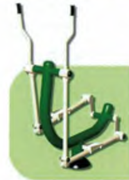
Dalt: Aparell destinat al treball de la musculatura lumbar i abdominal Baix: Aparell destinat a afavorir la funció cardíaca i muscular