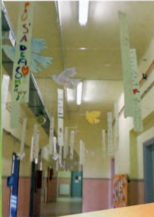
Diada de la Pau: El treball està exposat en els passadissos