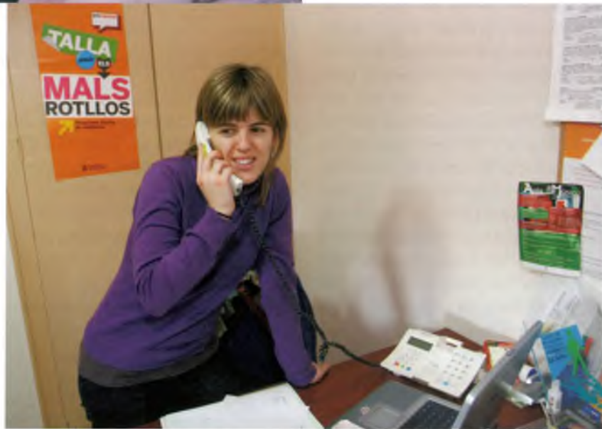
L'educadora social atén una trucada

El Pla d'Igualtat de la Dona és un dels projectes destacables en què ha intervingut la Treballadora Social i, tal com expliquen des de l'EBASP, el seu objectiu és treballar amb les dues associacions locals de dones. En aquest punt és