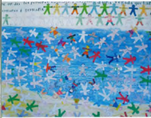
Diada de la Pau: Representació de la germanor