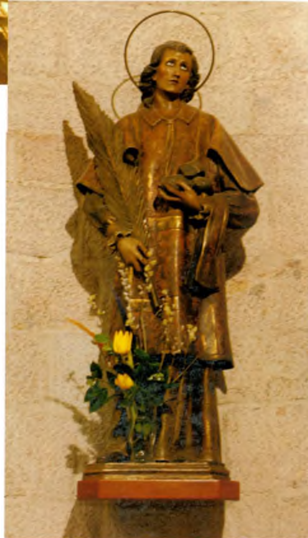
Sant Esteve, a l'absis principal