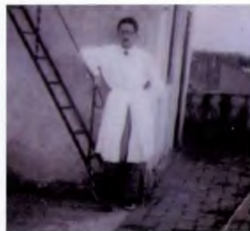
Vestit amb la bata de metge

La nit de la gran nevada de l'any 1962 vaig fer una visita a can Fornaca per atendre un part. Vaig anar-hi fent 5 quilòmetres a peu ja que els familiars no es van atrevir a venir-me a buscar amb tractor. El cas és que quan vaig arribar a la casa, la criatura ja havia nascut feliçment."