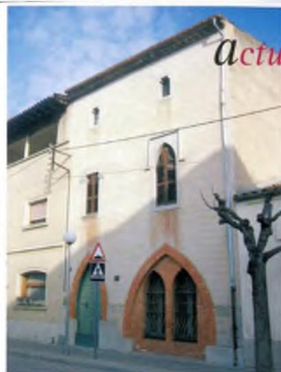
La casa Matheu, a l'Avinguda Dr. Furest