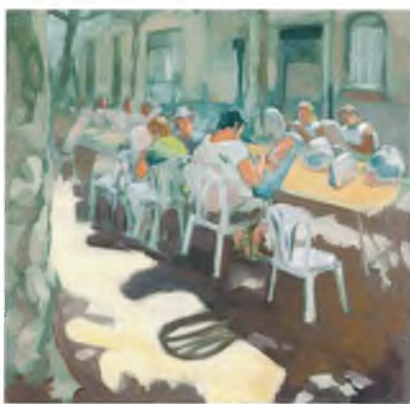
Primer premi de l'any 2007

C aldes de Malavella convoca per vuitè any consecutiu el seu Concurs de pintura ràpida amb plena voluntat que esdevingui un autèntic focus d'atracció d'artistes plàstics disposats a posar el seu talent a prova.