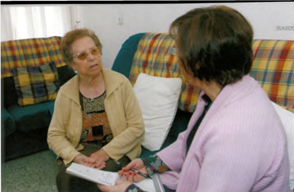
La treballadora comprova a domicili que els usuaris reben correctament els serveis

col·laboració: la majoria es van fer d'acord amb el sector sanitari (125), seguit de l'educatiu (87), amb altres serveis socials d'atenció primària (62) o municipals i en contacte amb la regidoria de Benestar Social (54), amb programes del Departament d'Acció Social i Ciutadania de la Generalitat (49), amb Serveis d'Atenció Domiciliària (48), els Equips d'Atenció a la Infància i Adolescència (32) i Càritas o altre voluntariat (31). A més distància però també amb un nombre destacable, s'han fet accions coordinades amb centres de dia o residencials per a gent gran (27), serveis per a persones amb disminució (26), casals d'estiu (23), amb els cossos de Mossos d'Esquadra i Policia Local (21), amb els responsables del Pla d'immigració i taules d'acollida (14) o de la Comissió d'absentisme i justícia juvenil (8) i en dues ocasions amb centres d'acollida per a infants. A aquestes dades encara s'hi pot afegir que, durant l'any passat, els serveis socials van oferir 115 atencions puntuals, van obrir 104 casos nous i van continuar treballant en 94 expedients arrossegats d'anys anteriors.