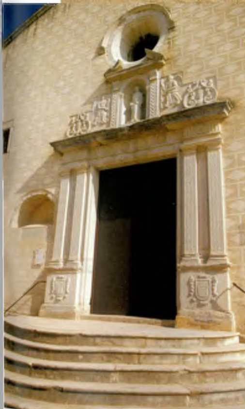
L'entrada és d'estil neoclàssic