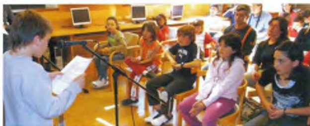
Un dels premiats de l'any passat llegint la seva obra

Per a més informació us podeu adreçar a l'Àrea de Cultura de l'Ajuntament de Caldes de Malavella (tel. 972 47 00 05 / a/e pcasas@caldesdemalavella.cat) i a la Biblioteca Municipal Francesc Ferrer i Guàrdia (tel. 972 47 23 50 i a/e biblioteca@caldesdemalavella.cat).