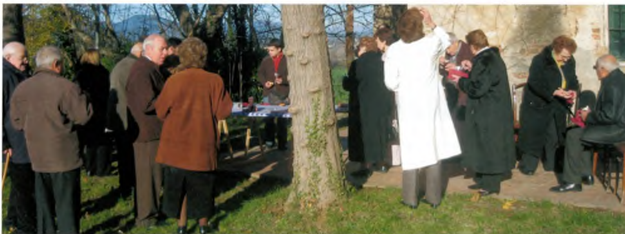
Esmorzar de xocolata i melindros en el dia de Nadal

U n any més i un de menys, depèn de l'edat i l'estat d'ànim de cadascú, però el temps com sempre imparabile. Enrera queda un 2008 complex, enrarit, que ha donat pas a un 2009 ple d'incògnites i incerteses. Però com diu el poema de Joseph Rudyard Kipling, "no defalleixis". I amb aquest consell comencem a parlar de Franciac.