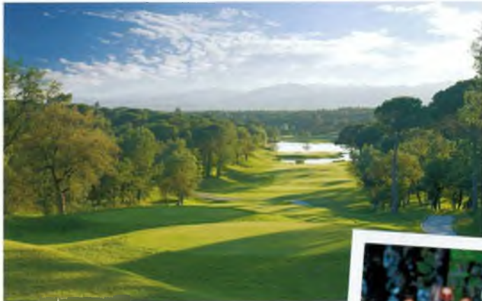
Stadium course, el lloc on es disputarà L'Obert

E l volum de xifres que mou la competició és més que considerable ja que compta amb uns 4.500.000 euros de pressupost, 2.000.000 d'euros en premis i un mínim assegurat de 400.000.000 d'espectadors de tot el món, amb seguiment en directe de diversos canals com Televisió espanyola (seguiment de 4 hores al dia) i Sky Sports. Encara no s'ha fet pública la llista de participants però es preveu que hi haurà jugadors de renom. A més, l'organització està treballant perquè puguin participar-hi jugadors del club.