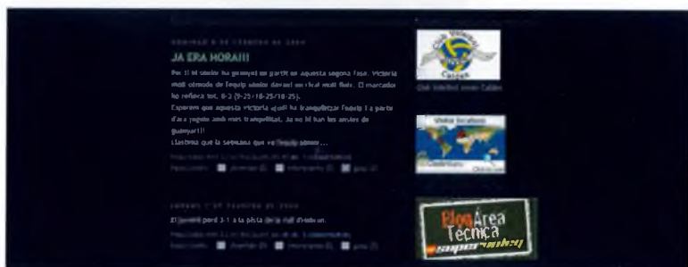
El Blog del grup

Joves Caldes. La gent que forma part d'aquest club pot estar satisfeta ja que s'ha aconseguit que el voleibol sigui un esport referent al nostre poble. De totes maneres, som inconformistes i per això seguirem treballant perquè tota la gent que estigui interessada pugui gaudir del nostre esport. Un dels grans reptes que ens plantejem es poder consolidar els nostres equips