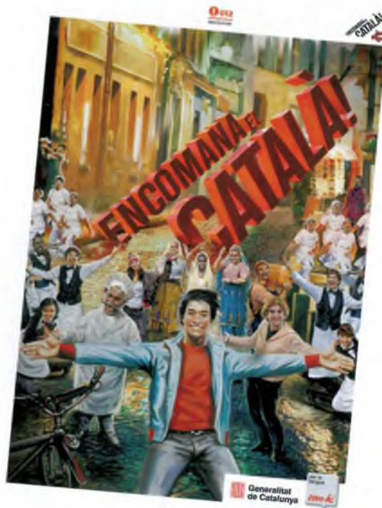
Cartell de l'última campanya de la Generalitat per fomentar l'ús del català.

Em pessigo la galta però estic despert i realment he viscut aquesta situació. No ho entenc. Resulta que demanar que m'enviïn una carta en català és ser "radical". Resulta que defensar poder viure íntegrament en català al meu país és ser "radical". I el més gros és que aquestes declaracions no vénen d'emissores i cadenes