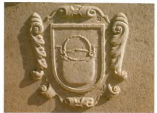
Un dels dos calderins que hi ha a la façana de l'església