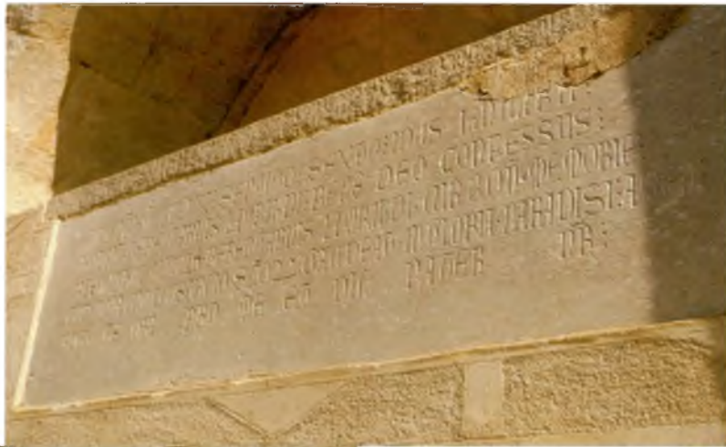
El sarcòfeg amb la inscripció en llatí