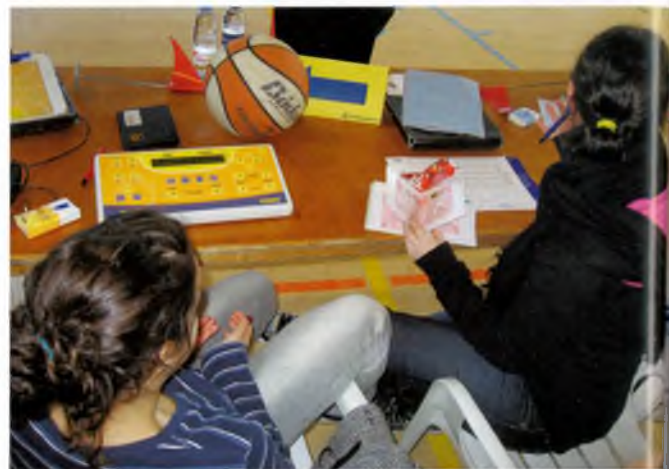
Dalt: Postal feta entre el Taller Ocupacional Ntra. Sra. Montserrat i els jugadors júnior i sub-21. Baix: La feina dels anotadors i cronos és important

informats de la gestió econòmica ordinària del Club i atès que l'assistència a l'Assemblea general no va ser multitudinària, aprofitem aquestes línies, per anar-vos informant de diverses despeses de gestió.