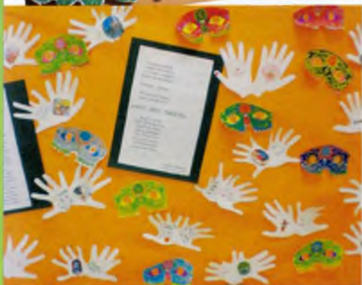
Per carnaval: Una màscara i el mural