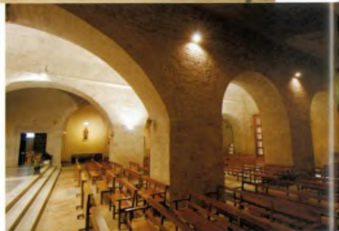
L'església té tres naus i la principal té 3 arcs

D'estil romànic, apareix en documentació datada l'any 1054, en la qual es fa referència a l'església Santi Stephani de Calidis. Aquesta és la primera constància escrita del recinte acompanyat del topònim del poble; tot i que ja se'n té referència anterior, de la segona meitat del segle X (l'any 968), quan es va consagrar el temple.