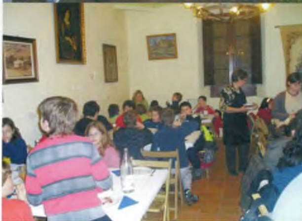
De dalt a baix: Fent espeleologia /Caminant entre la foscor / La recompensa, el sopar!

da des de Beuda pels límits de l'Empordà i la Garrotxa, el final del trimestre es presenta amb un parell de propostes molt atractives com són la bicicletada d'anada i tornada a Vilobí d'Onyar des de Caldes tot descobrint nous camins del nostre entorn, i la tradicional i cívica jornada de treball de la botineteja, aquest any amb calendari del 22 de març, que sempre és una bona oportunitat de participació ciutadana per a tots els caldens i entitats, i només amb l'única condició que faci bon temps, és clar.