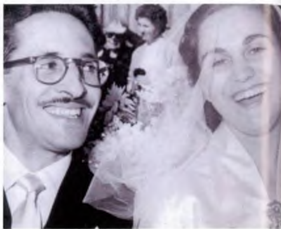
Imatge del casament