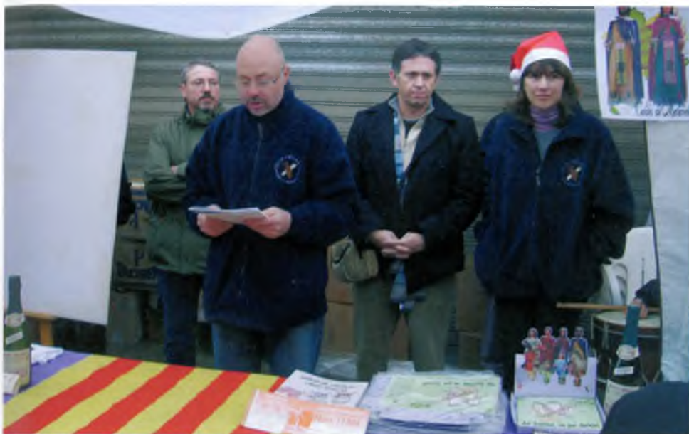
Presentació del conte