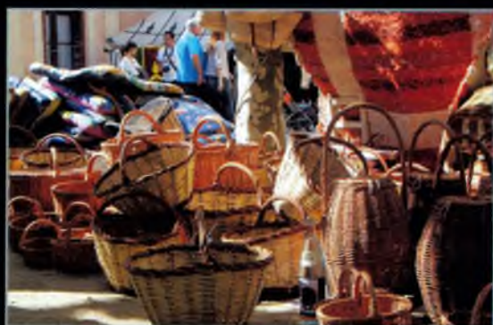
2n Premi juvenil a la fotografia més interessant de tema lliure, per a menors de 16 anys: Sandra Buhigas i Sanchez .