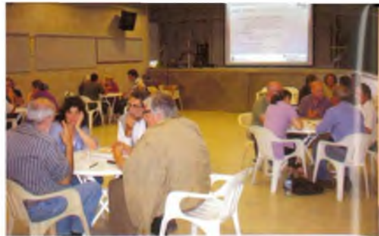
Sessió de novembre del Consell de Poble

La programació del Consell de Poble per aquest primer any acabarà el gener de 2011, quan es farà una avaluació del funcionament i es definirà el programa pel proper any. Tothom pot formar part del