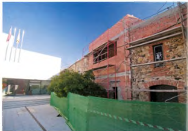
L'edifici des de la plaça de l'Ajuntament nou.