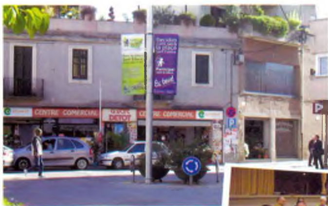
La plaça de Sant Esteve amb els cartells anunciant el procés participatiu

El 5 de novembre passat es va portar a terme una de les activitats més interessants dins el procés participatiu per reurbanitzar la plaça Sant Esteve. Es tractava d'una reunió oberta a tots els caldencs i caldenques on es va exposar com es pensava fer aquesta reforma i de quina manera hi participava la gent del poble. Hi va intervenir l'Alcalde, l'arquitecta municipal i el tècnic de participació ciutadana i va comptar amb l'assistència d'una vintena de persones.