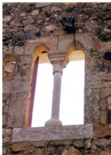
La finestra que dona al pati.

A La previsió és que la nova Oficina de Turisme de Caldes entri en funcionament al llarg del primer trimestre de 2011, encara que la complexitat i el cost dels treballs farà que les obres continuïn els propers anys. La fase actual del projecte consisteix, fonamentalment, en la consolidació de l'estructura d'un edifici molt mal·lès pel pas del temps. A mesura que avancin les actuacions, Cal Ferrer consolidarà la seva condició de centre neuràlgic de l'activitat del poble acollint, per exemple, un centre d'investigació de la cuina termal i una sala d'exposicions; a més, actuarà de nexa d'unió entre els edificis de l'antiga casa consistorial i la nova, connectats amb un pas elevat i acollint dependències com ara la sala de plens municipal i diversos despatsos.