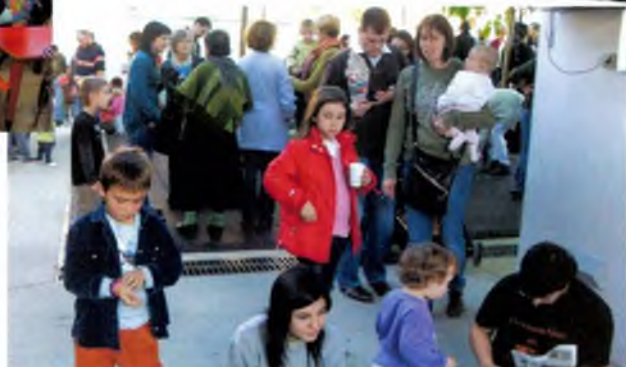
Menjem les castanyes tot junts