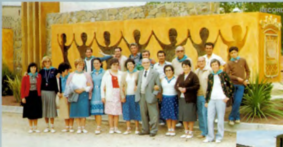
Visita d'un grup de Vilanova i la Geltrú, 9 de maig de 1980