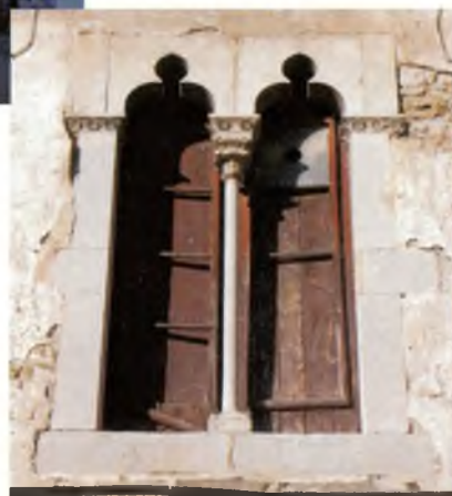
El finestral gòtic de la façana principal.