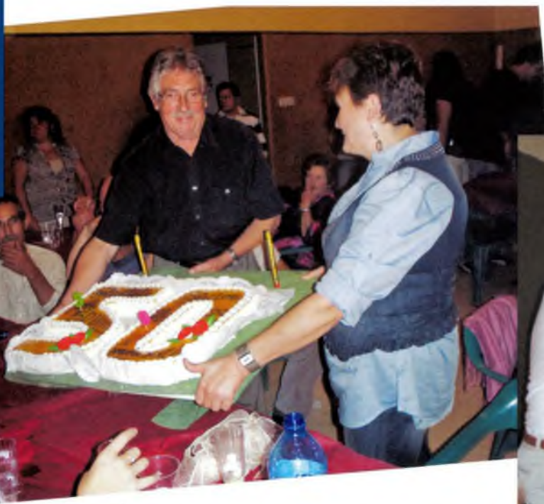
. El pastís d'homenatge