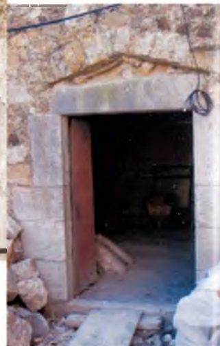
La porta d'accés al pati