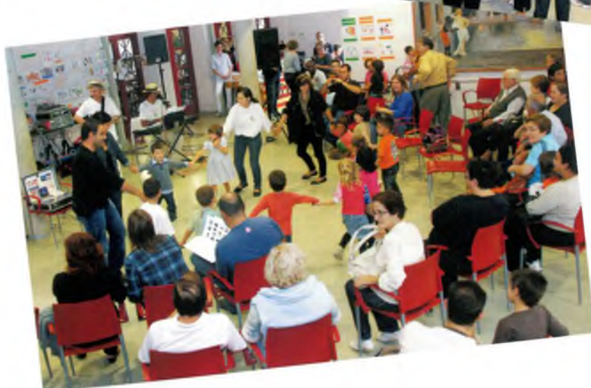
Ball amb el grup Corrandes