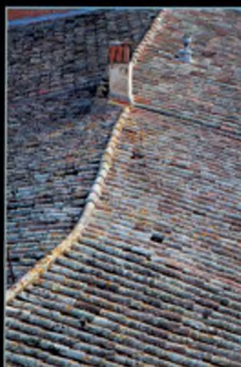
Premi a la millor fotografia del tema "Imatges de paisatge urbà vinculat a la vila de Caldes (imatges de conjunt, conjunts d'edificacions, trames urbanes, textures...)": Bernat Casero i Gumbau.