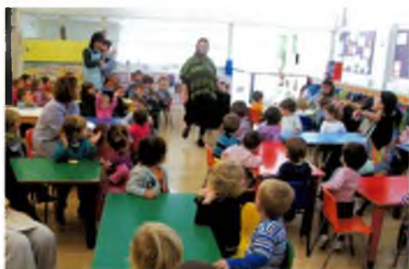
Cantem amb la castanyera