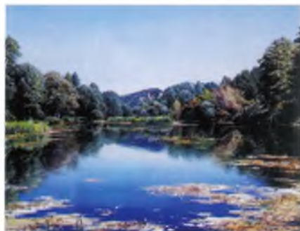
El Fluvià a la resclosa d'Orfes, de Josep Maria Solà