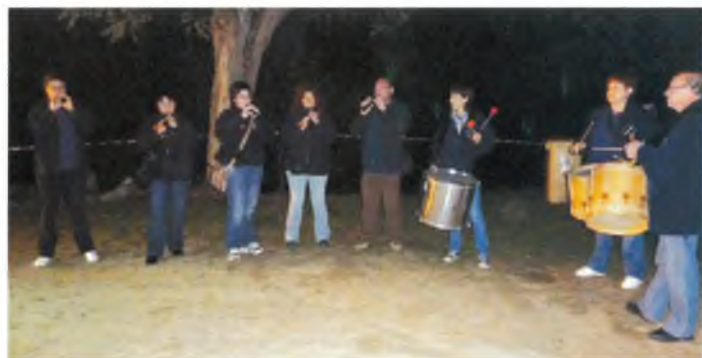
Tocant al Sant Maurici Jove