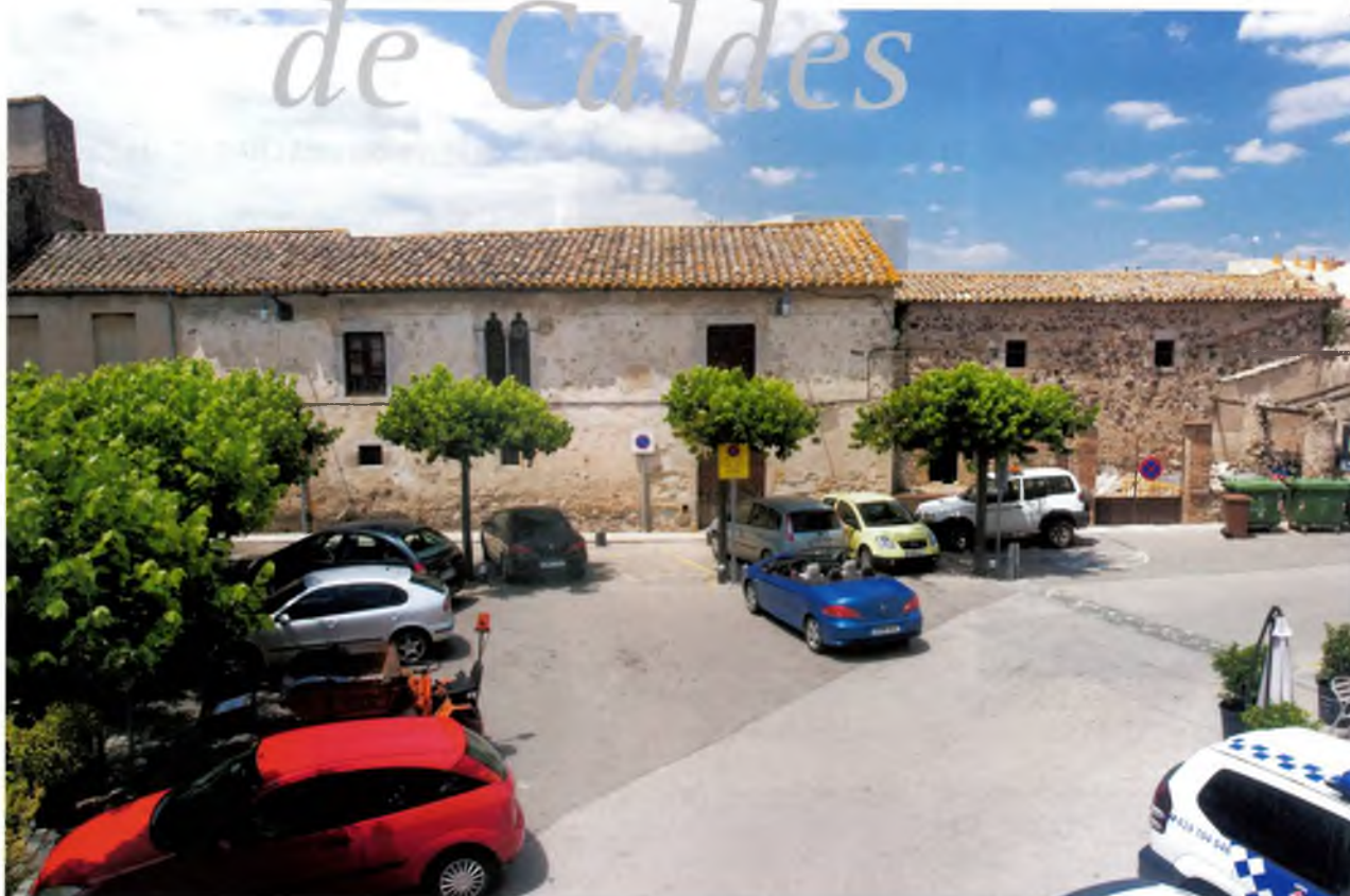
Cal Ferrer i la plaça de l'Ajuntament abans de l'inici de les obres