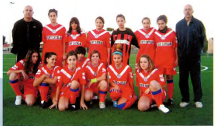
Equip cadet-juvenil femení el dia del partit amistós

L a temporada de la UE Caldes ja està en marxa per totes les categories. Tenim el primer equip, els juvenils, els cadets i els infantils jugant les lligues de futbol 11 i els dos equips d'alevins a les lligues de futbol 7 de la Federació Catalana de Futbol.