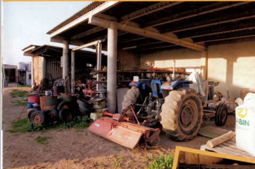
El cobert amb el tractor i altres estris del camp.