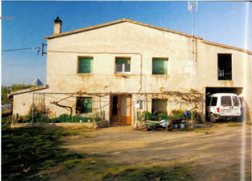
Ca l'Amargant actualment

Un nou repte va ser l'entrada a la Unió Europea, que va suposar l'establiment de quotes lleteres: "a cada explotació lletera ens tocava vendre tants litres de llet. Si les vaques en feien més, les plantes