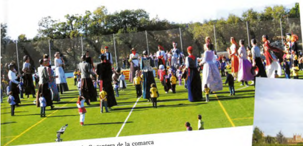
La Tercera Trobada Geganterera de la comarca

T emps era temps que dèiem... arriba el 2000! i vet aquí que ja acabem el 2010. I amb això, també la temporada geganterera d'aquest any. Una temporada atapeïda de sortides, activitats i festes sorpresa. Un any on la mainada i no tan mainada recordarà com l'any de la tornada de la Malavella.