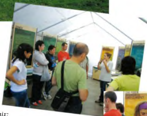
De dalt a baix: Participants en la caminada guiada. Visita guiada a l'exposició. Jugant amb les taules interactives.