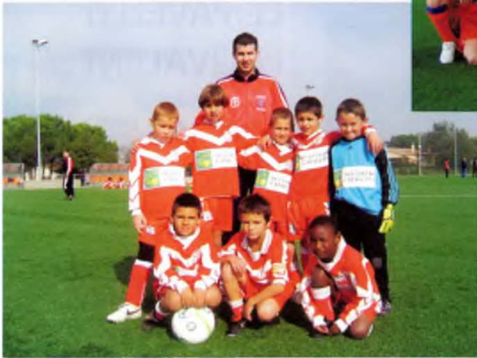
Equip pre-benjamí "A"