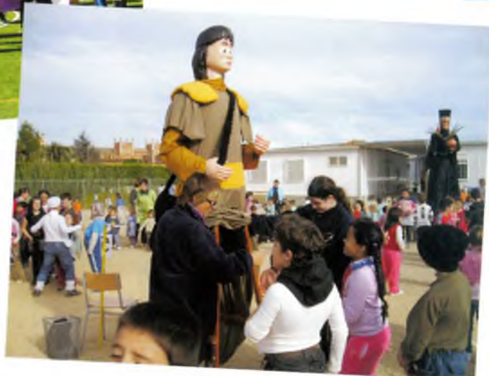
Vam celebrar la castanyada a la Benaula.

*Per estar ben informats de les nostres activitats podeu connectar-vos al nostre web i a partir d'ara també al Facebook (posant al cercador: Colla Geganterera de Caldes de Malavella i Grallers Escaldats). ■