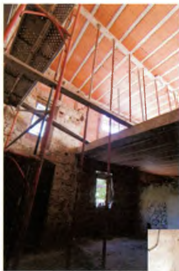
Una altra habitació ja coberta.