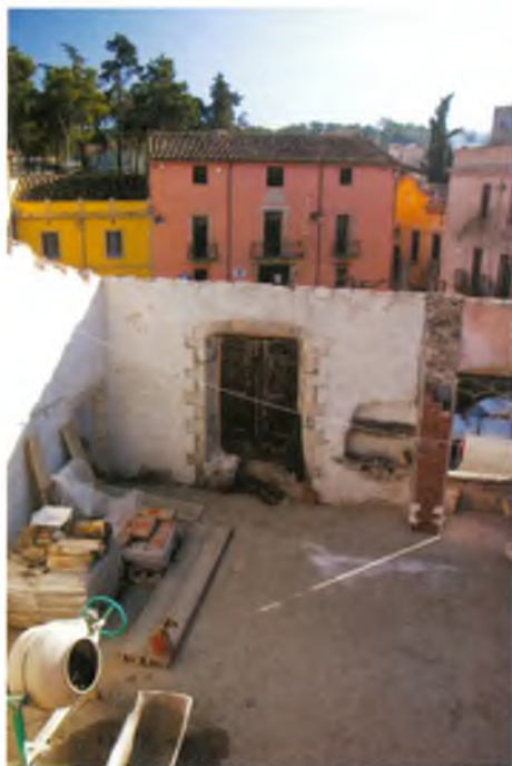
Una estança al descobert per les obres i, al fons, l'antic edifici de l'Ajuntament.