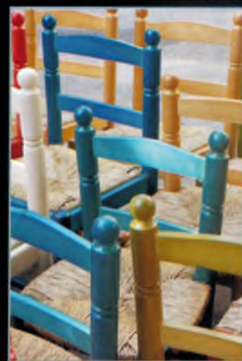
Premi a la millor fotografia del tema "Imatges de Caldes la composició de les quals tingui el color blau com a color principal o predominant, o que hi aparegui de manera destacada": Helena Ordoñez i Planas.