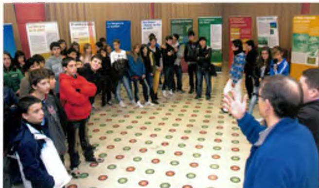
Visita d'un grup del SES a l'exposició

La tarda va començar amb l'arribada de la senyera ja que la flama no va poder entrar a la sala annexa de la Casa Rosa (hi havia previsió de pluja i vam decidir de traslladar els actes). En va fer la recepció l'alcalde i el regidor de Cultura. Després de la lectura del manifest, el grup d'animació Corrandes va oferir-nos un entretingut repertori que es va cul-