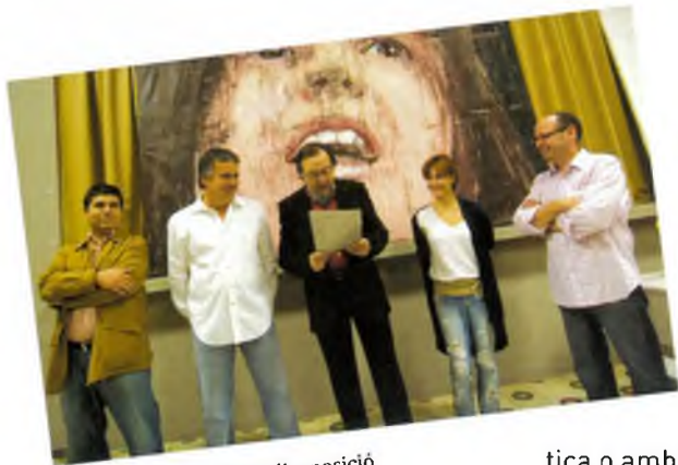
Acte d'inauguració de l'exposició