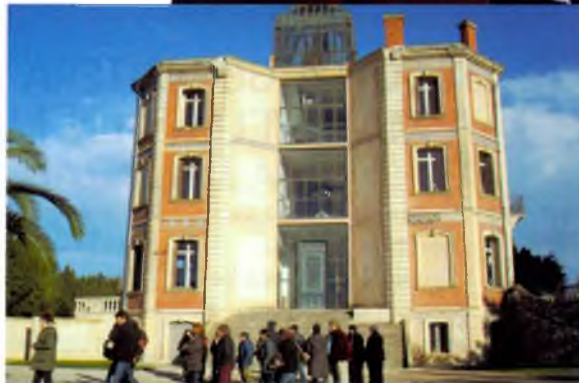
De dalt a baix: Foto de grup. / Museu Memorial de l'Exili. / La Maternitat d'Elna.