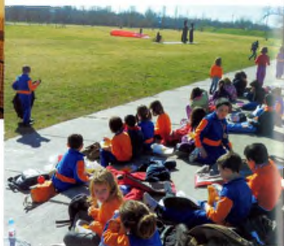
Parc de Fontajau de Girona

Després, vam anar a fer un vol per la Devesa a veure els plataners: les fulles, els fruits, el tronc... Vam veure que eren uns arbres molt vells i molt alts: fan uns 55 metres!