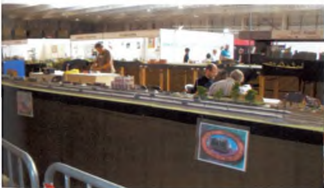
Expotren, Lleida 2010