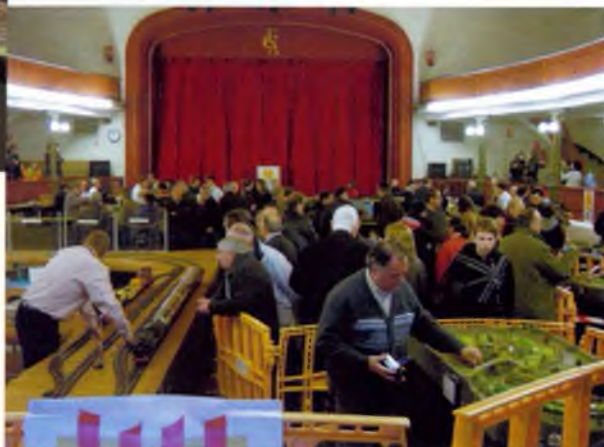
Trobada mòduls a Molins de Rei 2010