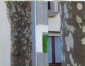
Cal agafar el trencant en la direcció indicada (en el cas de la foto, cap a la dreta)