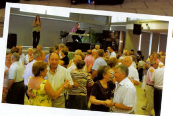
Ball de la Festa Major 2010

Cal no oblidar el ball que es fa cada diumenge, de 5 a 8, així com