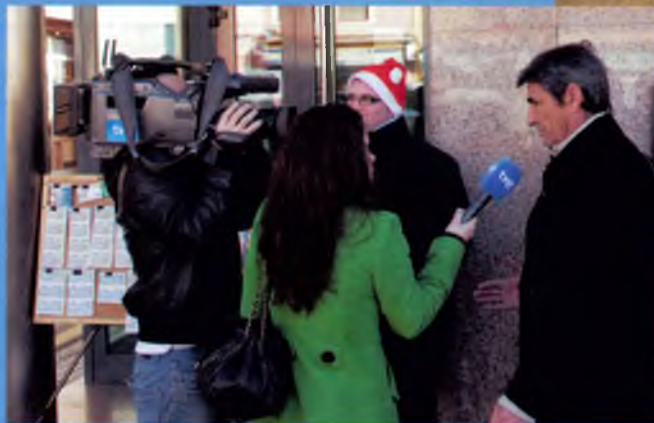
Els mitjans es van interessar pel terratrèmol del 19 de desembre