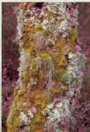
Molses i líquens