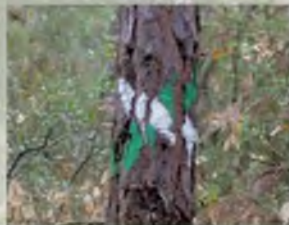
Camí incorrecte per la ruta que estem seguint