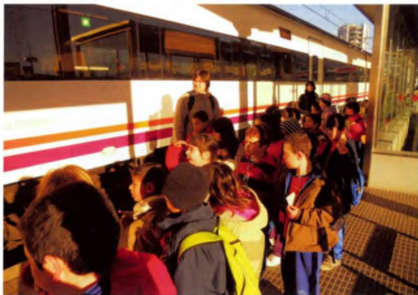
Estació de tren de Girona

Nosaltres som els nens i nenes de primer de La Benaula. Ens agradaria explicar-vos que el dia 3 de febrer vam anar d'excursió a Girona amb tren.