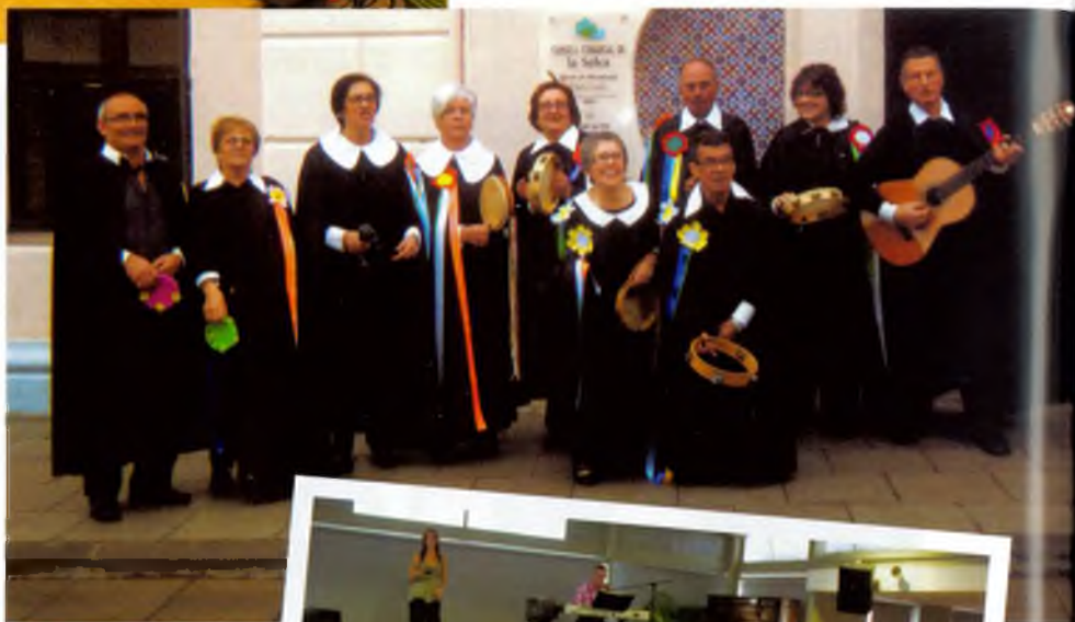
Disfressa de Carnestoltes. També hi ha lloc per a la disbauxa!

La intenció del grup és seguir la mateixa línia que l'anterior Junta amb la incorporació d'alguna idea nova. Estan pensant, per exemple, en fer algun ball entre setmana, un cop al mes o cada dos mesos. També estudien la possibilitat de fer un ball i una festa de cap d'any. Veiem que de ganes de fer coses no