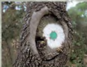
Camí correcte (variant)