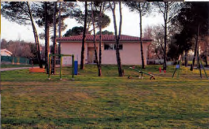
D'esquerra a dreta i de dalt a baix: El camp de futbol. Sala d'esplai del Local social El Local social, punt de trobada. Punt de lectura del Local social.

vulgui deixar-hi el cotxe. Aquesta mesura va a favor dels vianants i dels ciclistes que poden passejar lliurement però és una mica molest per la gent que va a casa i se'n torna diverses vegades al dia ja que no pot aparcar davant de casa i ha de caminar una mica. De totes maneres, afirmen, les parcel·les són prou grans com perquè s'hi pugui deixar els cotxes a dins.