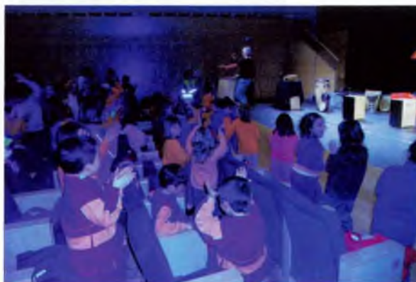
Auditori - Palau de Congressos de Girona

Girona a escoltar música de percussió. L'audició es deia "Percussions a domicili" i ens va encantar! Vam conèixer molts instruments fets de fusta, de metall o de pell de cabra, com per exemple, el tub vas, els bongos, el triangle, la caixa xinesa, el güiro, el plat, el xilòfon... fins i tot van fer música amb les escombres!