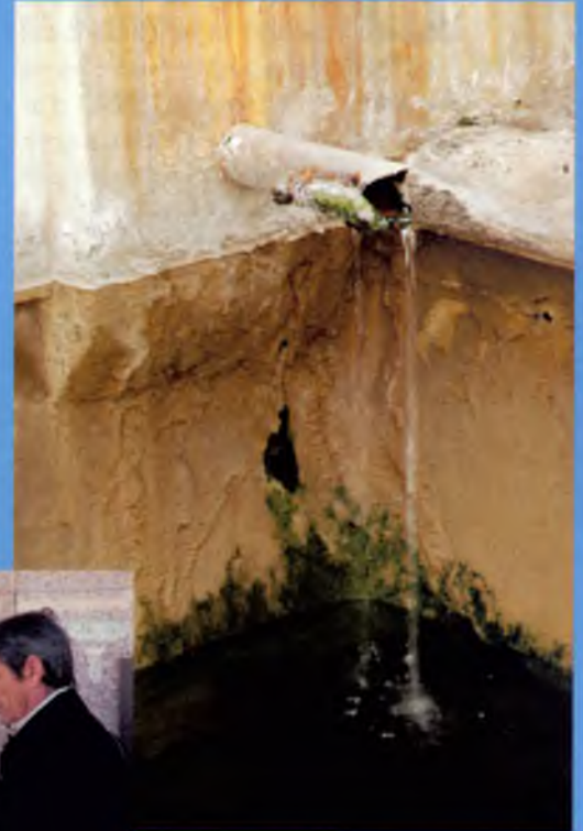
la font dels safarejtos, al costat de la font de la Mina

El mateix dia i següents eren habituals a Caldes els comentaris sobre si cadascú havia sentit o no el terratrèmol, les circumstàncies en què s'havia viscut (la majoria de casos dormint, ja que era mig quart de 8 del matí d'un diumenge) i els efectes en les llars (tremolors i petits moviments i vibracions de mobles o objectes). Diversos mitjans de comunicació es van desplaçar al nostre municipi i no era estrany veure càmeres de televisió amunt i avall preguntant als veïns com havien viscut l'experiència. D'aquesta manera, diversos veïns van aparèixer a la televisió explicant alguns el que havien viscut i altres,