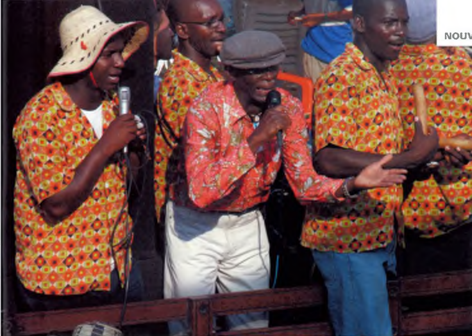
Carnestoltes a Barranquilla, Colòmbia.