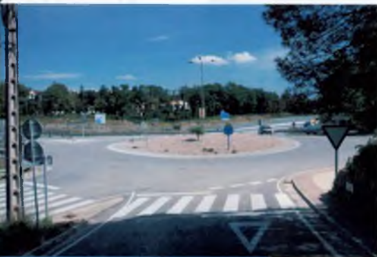
D'esquerra a dreta i de dalt a baix: Àrea d'esbarjo a la zona esportiva. / Rotonda d'arribada al veïnat i d'accés a l'autovia. / El carrer del Mig. / Vista de la urbanització des del carrer de Santa seclina, a prop de l'ermita del mateix nom.