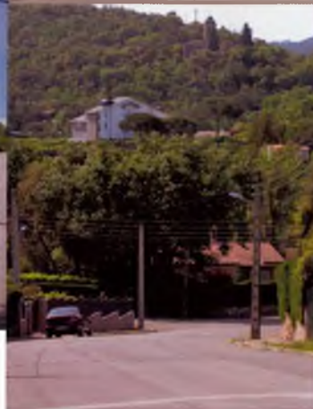
D'esquerra a dreta i de dalt a baix: Carrer Bellavista. / La plaça de la Selva. / Confluència de l'Avinguda de Montserrat i el carrer Collformic. / Vista de Santa Seclina des de l'Av. Montserrat.