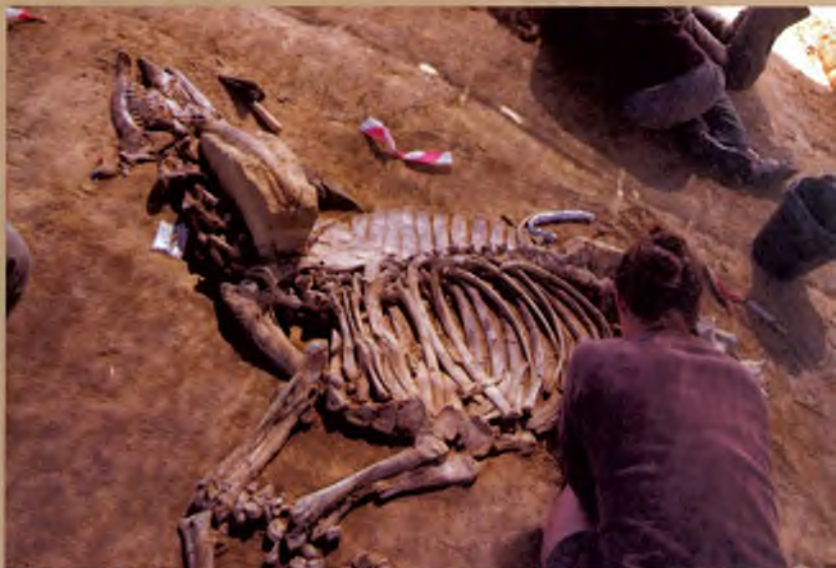
El fòssil de bòvid també està molt ben conservat.

Les excavacions al Camp dels Ninots continuen donant fruits amb la recuperació aquest any d'un fòssil de tapir ( Tapirus Arvernensis ) i d'un altre de bòvid ( Alephis Tignerisi ). Enguany les troballes són excepcionals ja que s'han trobat a molt poca profunditat, amb la qual cosa la terra no ha aixafat els fòssils com en altres exemplars anteriors sinó que s'han conservat amb tot el seu volum. A més, el tapir recuperat és jove, la qual cosa permetrà obtenir noves dades d'aquesta espècie.