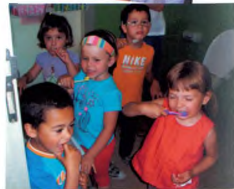
Després de dinar, a rentar-se les dents.