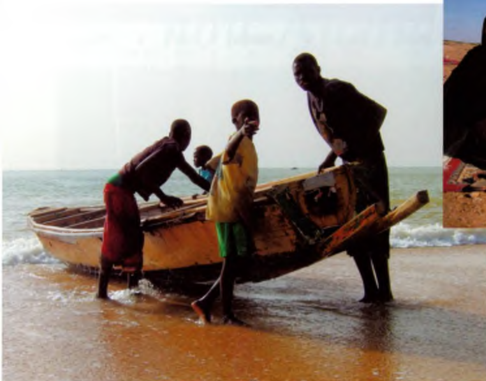
Pescadors a Nianing, Senegal.

Caldes! Un poble que veiem tancat i fred des del sud, des dels països càlids i extravertits. I que resulta més obert i afectuós des de la gelidesa dels països nòrdics. Res no és; senzillament sembla segons el punt de referència que es tinguin. Aquí estem! Fent poble, agràits a Caldes i estimant-lo ja que l'hem triat voluntàriament, per ser bonic, tranquil, acollidor i ideal per a la mainada. En aquest article veurem el punt de vista d'alguns dels molts caldens que hem nascut fora de Catalunya. Deixeu-me que jo, com a canària, també hi posi la meva cullerada.