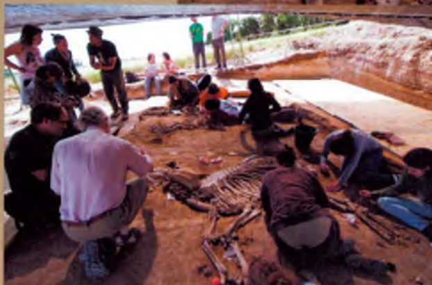
Visió general del jaciment

E l Camp dels ninots és un referent europeu per estudiar la vida animal i vegetal fa uns 3.500.000 milions d'anys. L'origen és un volcà que es va extingir i omplir d'aigua, que va ser un reclam per als animals. Per causes encara no