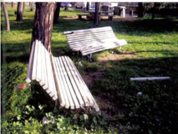
Alguns punts problemàtics segons el Consell de Poble