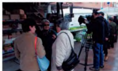
Captant l'ambient de mercat