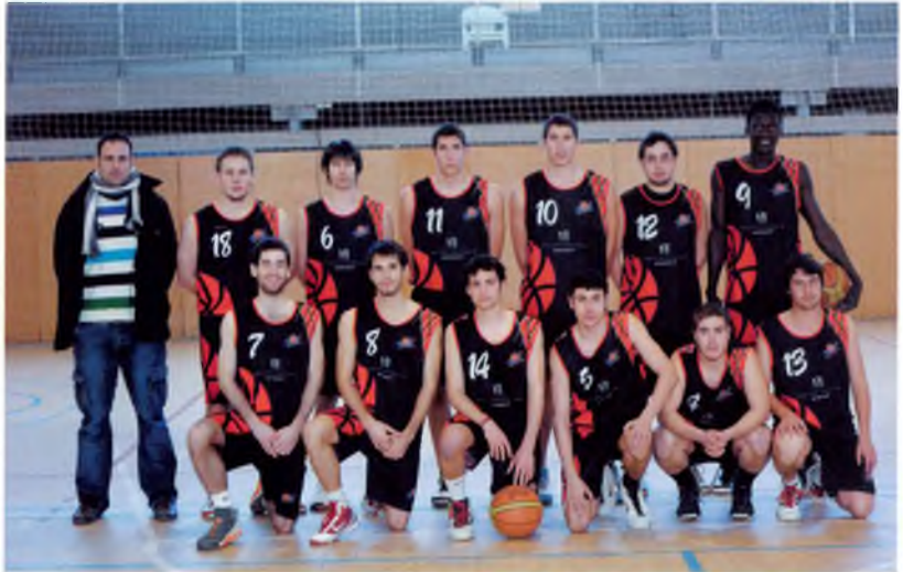
L'actual equip sènior.