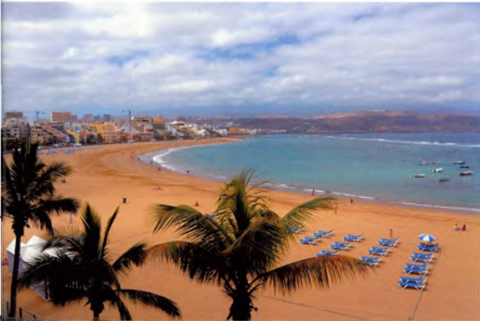
Platja de Las Canteras (Gran Canaria)

poble i això fa mal. Per tant, trobo un tancament al meu voltant. Jo també practico la dita d'"allà donde fueras haz lo que vieras" i m'ha portat entre altres belleses de Caldes a gaudir d'una riquesa cultural i gastronòmica deliciosa.