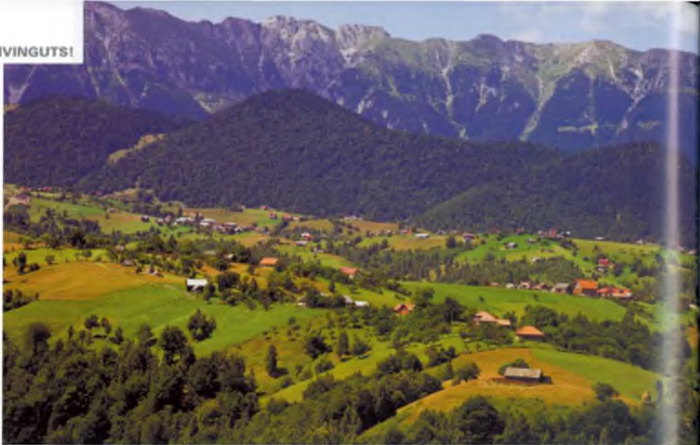
Paisatge des de la carretera ente Rucar i Bran (Romania).

Fa pensar! Com de més al sud venim, més freda trobem Catalunya; com més del nord, més càlida la veuen... què tindrà a veure el clima amb la gent? Tots vivim i ens avenim, això sí és riquesa cultural.