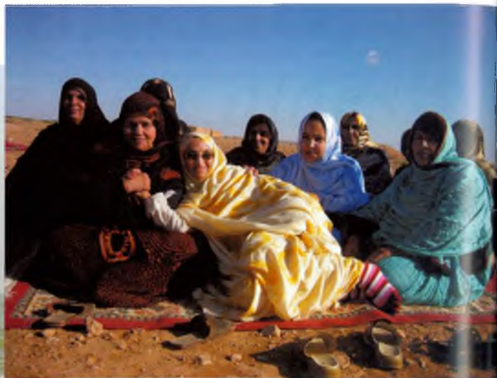
Amina Haidar, activista i líder sahrauí.

als camps de refugiats a conèixer la família, on tothom parlava castellà. Ha viatjat molt fins que fa uns deu anys va tornar als camps i va aconseguir una beca d'estudis per a la UdG. Pels camps de refugiats havia sentit el castellà i "des de la meua ignorància, no m'imaginava que aquí hi hauria una altra llengua que m'impossibilitaria els plans".