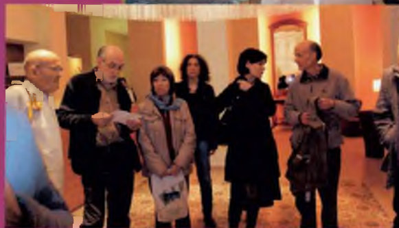
De dalt a baix: Comentant Heròdot / De visita al Balneari Prats

les properes i de molts altres temes en teniu més informació al bloc del club: