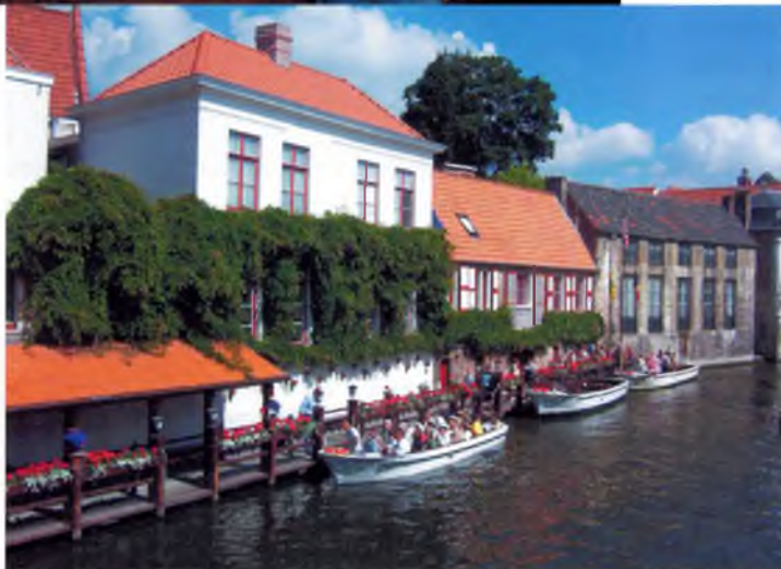
Canals de Bruges, Flandes.

Com podem comprovar no tots hem vingut per necessitats de fugir d'un altre país. Tot i que, potser, hi ha una majoria que ha emigrat per aquest motius, ens fem la idea