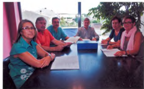
L'equip de govern a la sala de reunions