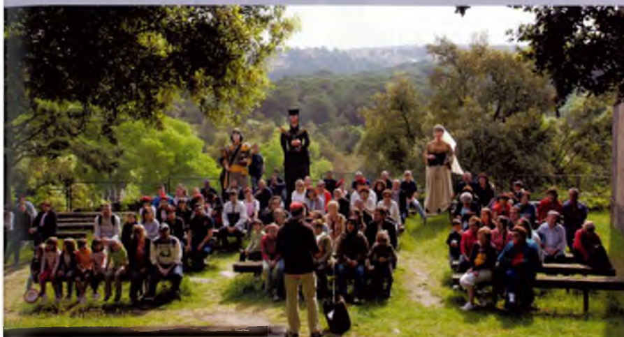
Cercavila del matí