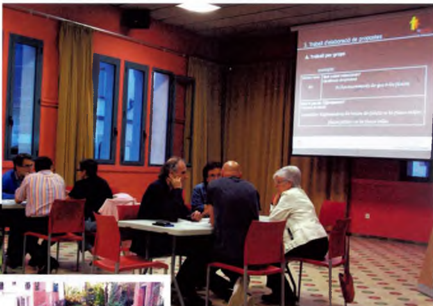
Imatge d'una sessió recent del Consell de Poble

La democràcia participativa és ben present a Caldes de Malavella per mitjà del Consell de Poble. Com ja és sabut, aquest òrgan s'encarrega de proposar millores al poble i seleccionar les més adequades perquè l'Ajuntament les porti a terme en el seu pressupost.