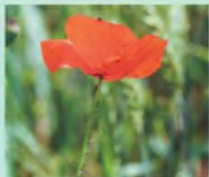
Galls gallerics, quiquiriquís o roselles