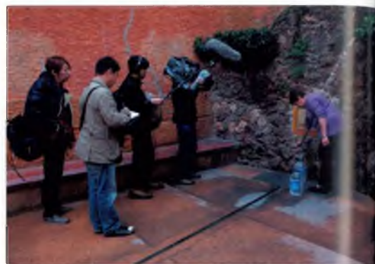
A la font del Raig d'en Mel

U n equip de la televisió japonesa BS NTV va venir a Caldes el 29 de març passat per rodar escenes del nostre municipi. Els reporters treballen pel programa "Europa a través de l'aigua" i van visitar diferents punts d'interès com són les fonts termals, els balnearis, l'exposició del Camp dels Ninots i les galetes Vichy. ■