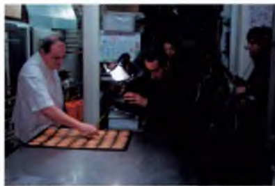
Gravant l'elaboració de les galetes Vichy

U n equip de la televisió japonesa BS NTV va venir a Caldes el 29 de març passat per rodar escenes del nostre municipi. Els reporters treballen pel programa "Europa a través de l'aigua" i van visitar diferents punts d'interès com són les fonts termals, els balnearis, l'exposició del Camp dels Ninots i les galetes Vichy. ■