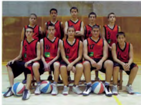
Els jugadors l'any 2004.

demostrat el que es pot aconseguir si s'està disposat a treballar dur; un equip limitat pel nombre de jugadors ha tingut una progressió excepcional durant la temporada amb una millora del joc que en les darreres jornades s'ha confirmat amb els resultats dels partits. Enhorabona jugadores, sou fantàstiques.