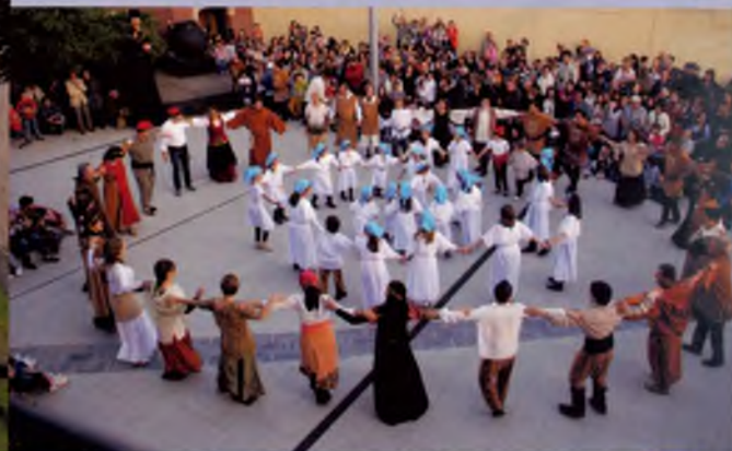
Festa de la Malavella

Com si no hagués estat res, ja tornem a ser aquí. Passen els mesos i la Colla Geganterera va agafant més força de cara a aquesta temporada 2011.