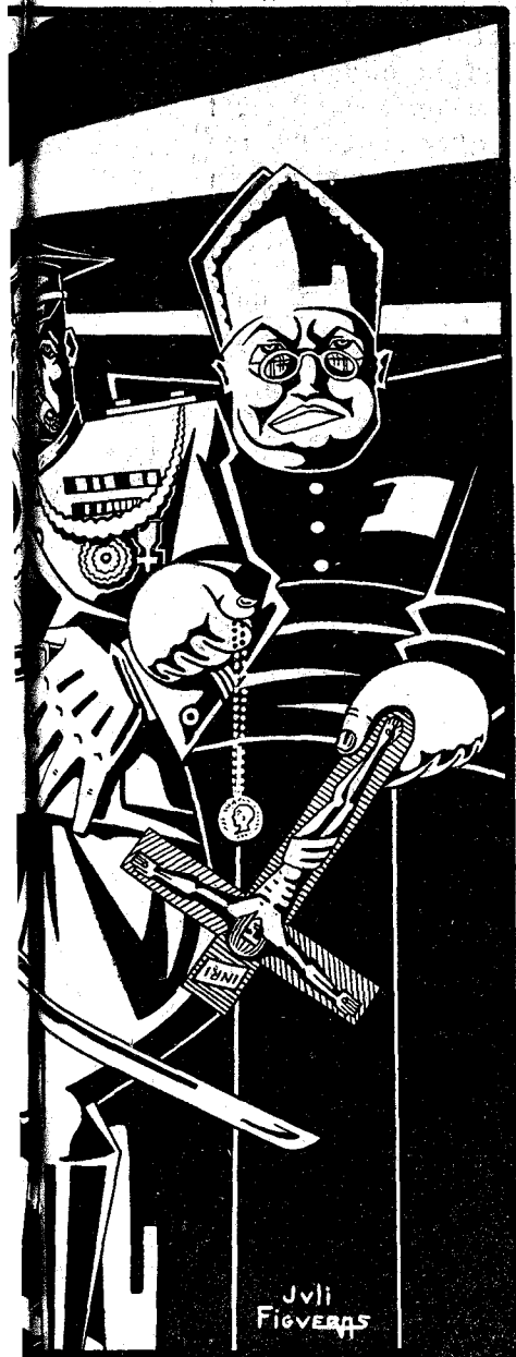
EN LA GUERRA.