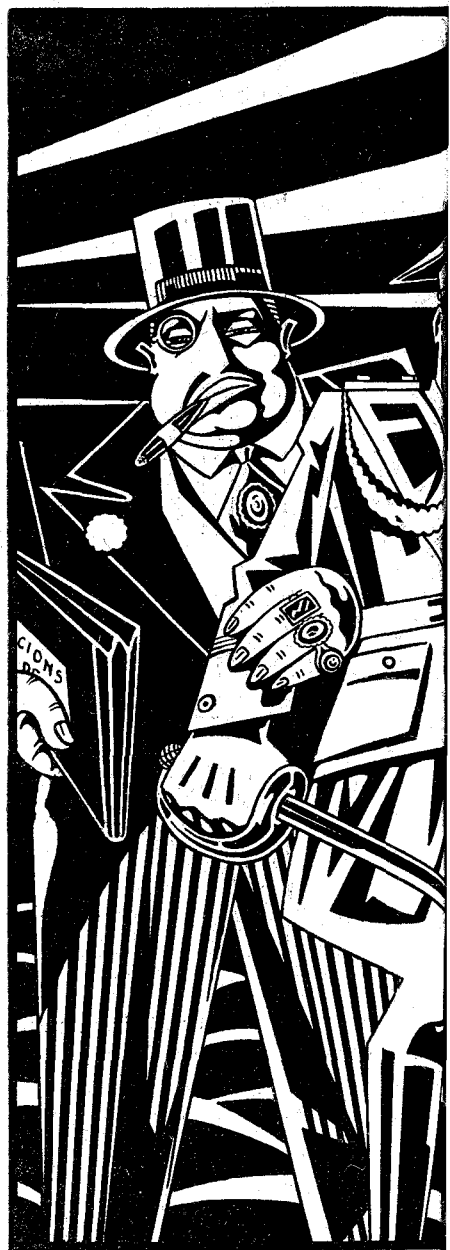
ELS QUE NECES

Els horrors de la guerra passada ja no commouen a la classe benestant. Com que varen escapar-se'n pensen que ara faran igual, i per això no paren d'enaltir el seu patriotisme mal entès, el patriotisme