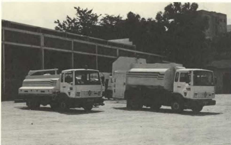
Els camions de recollida d'escombraries treballaran diàriament a partir del mes de març

A l'hora de redactar les condicions del servei d'escombraries que funcionarà a partir del mes de març, els tècnics de l'Àrea d'Urbanisme i Medi Ambient han