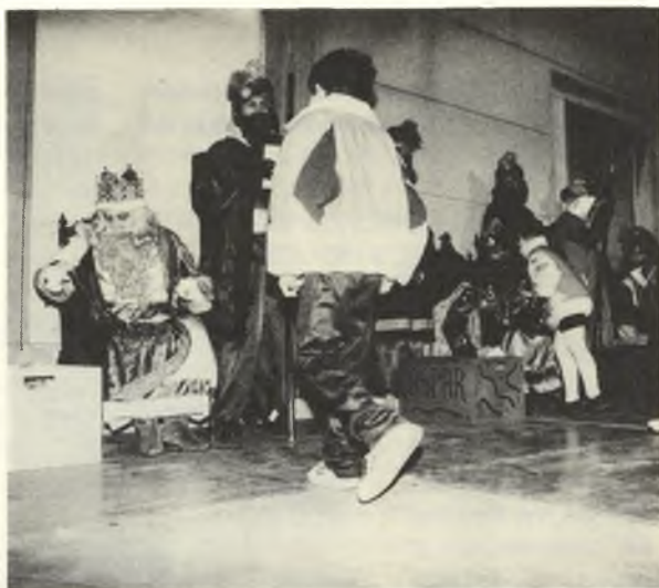
◆ Davant l'edifici consistorial, els tres Reis d'Orient repartiren caramels i dolços que van fer contents tots els petits.