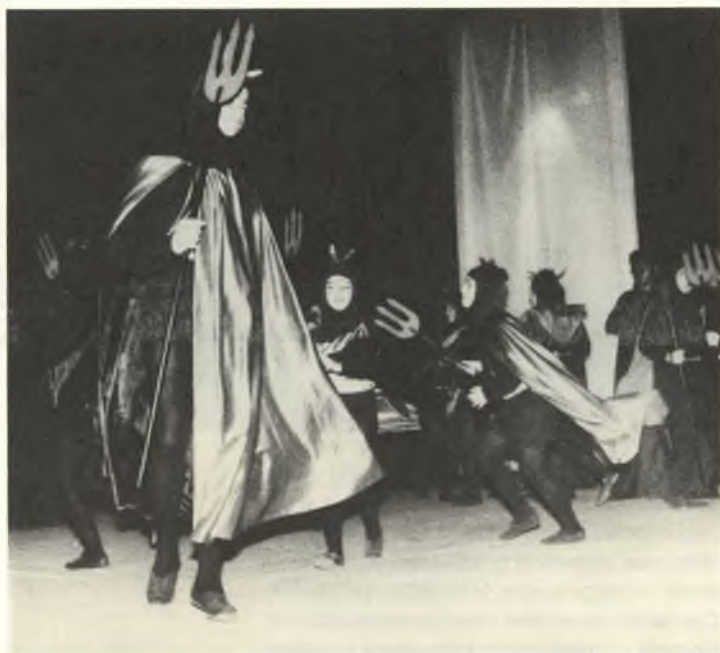
◆ Representació d'Els Pastorets, al Teatre-Auditori, a càrrec de l'Agrupació Teatral Benet Escrivà. Enguany amb una versió especial anomenada "Els Pastorets de Sant Feliu" que la portaren a escena entorn d'un centenar d'actors.