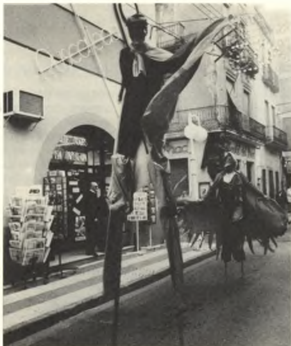
◆Acomiadàrem el 91 amb una cercavila: la de l'Home dels Nassos i dels seus extravagants companys.