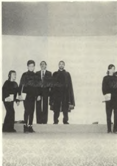
◆ Representació d'Els Pastorets, a la Parròquia de Vilartagues, a càrrec del seu grup d'Esplai.