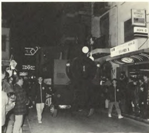
◆ El nostre tren petit guiava la Cavalcada de Reis i ens recordava que l'any que hem començat commemorem els 100 anys de la seva inauguració.