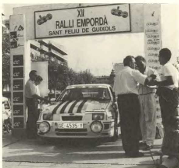
La sortida del ral.li Empordà a Sant Feliu, un dels aspectes de la promoció de la nostra ciutat per enguany

Entre les activitats de promoció previstes hi ha